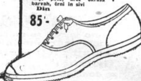
Vrsta: 4138-20079. Čevlji za vsakega, za udobnost, za sport, za izlet in dnevno uporabo. V vseh velikostih in barvah, beli, sivi in črni.