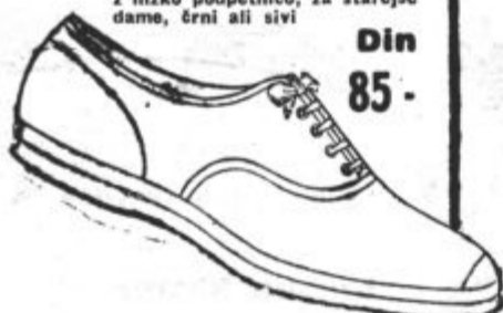
Vrsta: 4138-10076. Čevlji za tenis z vulkaniziranimi podplati iz sive gume

Din za gospode . . . 99- za dame . . . 89-