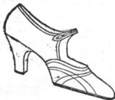
Vrsta: 4155-10225. Ženski čevlji iz najboljšega lanenega platna v barvah, sivi, beli ali drap