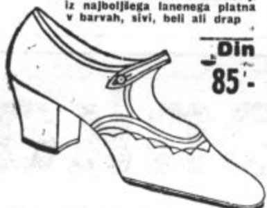
Vrsta: 6145-10635. Ženski čevlji iz lanenega platna z nižjo podpetnico, sivi, beli ali beš