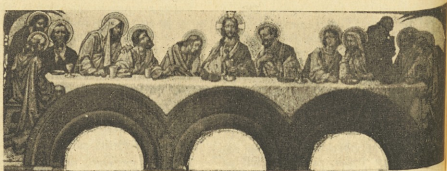
„Zadnja večerja“ — stenska slika v cerkvi Najsvetejšega Zakramenta v Bs. Airesu