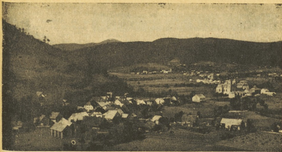
Trg žiri v Poljanski dolini

rad stopil tja gori. Saj je iz Rovt komaj uro hoda. Posodili so mi kolo. Kar hitro sem bil pri Popitu. Od tam pa je sedaj speljana nova cesta, ki gre na Smrečje in Vrhniko.