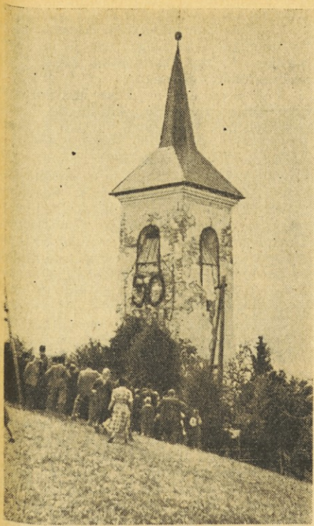
Sv. Mohor v župniji Selca, 1000 m visoko

šena za to. Bodo že otroci sami doma. Saj so veliki in pametni in že se sme nanje zanesti.