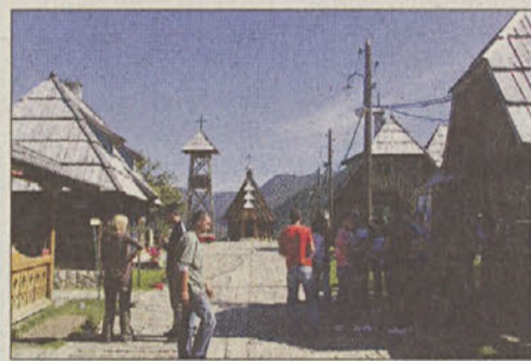
Etno vas Emira Kusturice