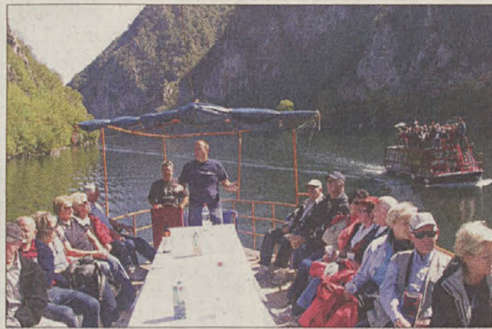
Vožnja po Drini