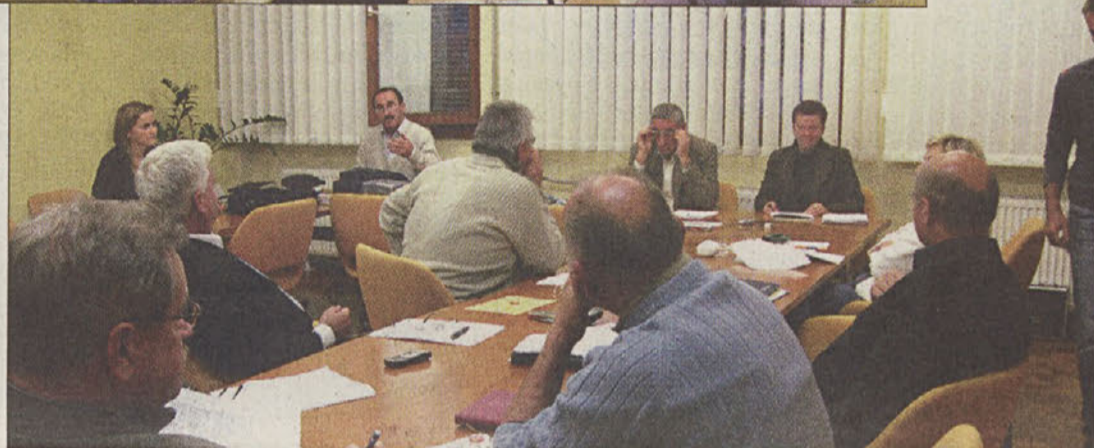
Občinski svet Kostanjevica na Krki