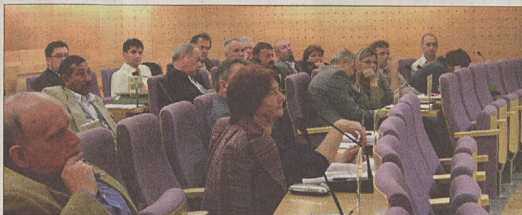
Občinski svet Krško