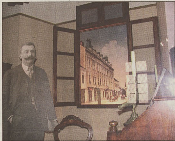
Nova muzejska zbirka

Stalna razstava bo spomin na pretekle čase, je dejal Vizjak , kajti ločnica med mestom in torej med meščanstvom in podeželjem je zdaj dodobra