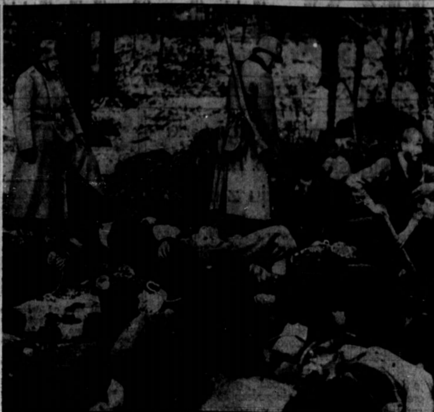
POLJAKI SI MORAJO KOPATI GROBOVE, posebno poljski Zidje, kadar jih gestapo obsodi v smrt in in neče delati nadloge, da bi za kopanje jam v smrt obsojenim druge najemal. Goraje je slika iz Poljske, kjer naciji na debele trebijo Poljake in poljske Zidje. Sedaj se tem krajem bliža rdeča armada.

Turčija meni, da ga bosta varovali Velika Britanija in Zed. države, in da bo svet pod njuno kontrolo, dokler bo, namreč, do časa, ko se prične tretja svetovna vojna.