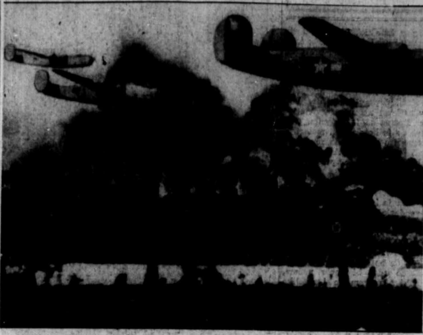
RUMUNIJA POMAGA NEMČIJI ne samo s svojo armado v vojni z Rusijo, ampak tudi s žitom, največ pa z oljem, na katerem je ona najbogatejša dežela v Evropi. Rusija je sicer na tem prirodnem daru veliko bolj oblagodarjena, toda njeni vreči so v Aziji. Rumunske oljne vreče so pred nekaj tedni napadli ameriški bombniki, v nadi, da jih Nemcem onemogočijo za dolgo časa. Četudi je bil ta napad največ v korist Sovjetske unije, so se dogodila vendarle nesoglasja z njo zato, ker so poročila po objavi tega napada začela trditi, da rusko vrhovno poveljstvo ni hotelo dati ameriškim letalcem svojih vzletališč na razpologo, pa so morali valed tega napraviti v Ploesti v Rumuniji tojko daljšo pot. A izgleda, da so bila vzkrok temu nesporazumu kakne druge stvari, kajti ne ena ne druga vlada ni skušala ustvariti afera iz tega. Vseeno, Ploesti je doživljal ogromne požare in ikodo, a tudi mnogo ameriških letal je nemika obramba zbila na tla.