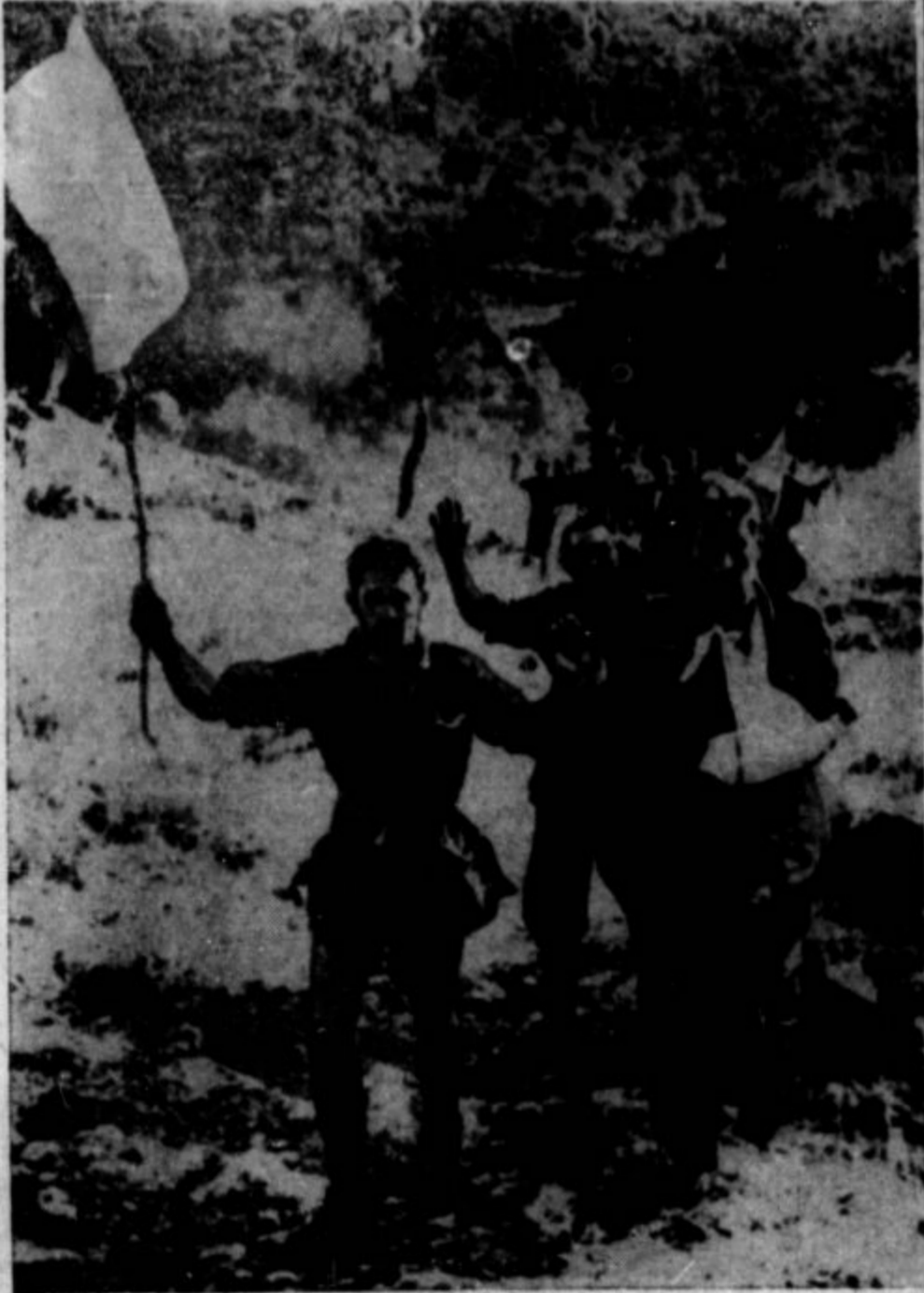
ITALIJA SE JE PODALA, a vzlic temu smo v vojni z njo ne samo zaradi nemških čet, ki jo branijo, ampak tudi radi tega, ker kralj in Badoglio s svojo predajo nista imela pod kontrolo njune armade, ki je štela krog tri milijone dobro oboroženih mož, bržkone precej več. Nemcev ni hotela izgnati iz svoje dežele nego jo je prepustila skoro brez odpora Hitlerjevimi četam. Kralj in Badoglio pa sta pobegnila iz njunega Rima pod naše varstvo. Na gornji sliki je skupina gladnih italijanskih vojakov, ki so se predali ameriški invazijski armadi čim so jo ugledali, v nadi, da dobe od nje zaščito in hrano.