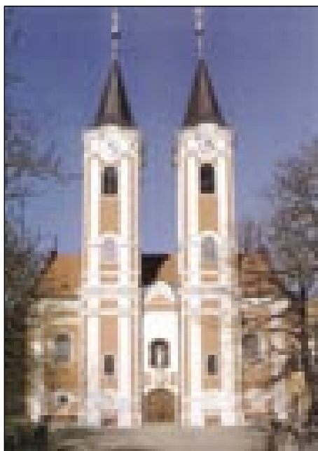
Romarsko cerkev v Máriagyűdü so zozidali l. 1739