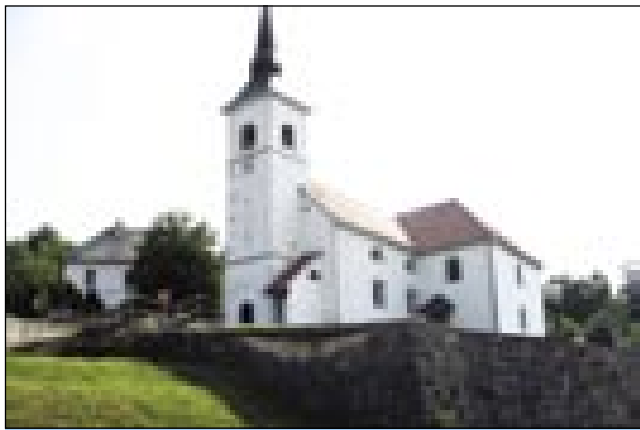
Cerkev sv. Martina v Podzemlju

sausadnjoj vesi, smo šli pejški do Kolpe, do grajnca s Hrvatsko. Snemalec Géza Doma je tak batriven biu, ka se je skau-po tó. Prejk kočevske gaušče