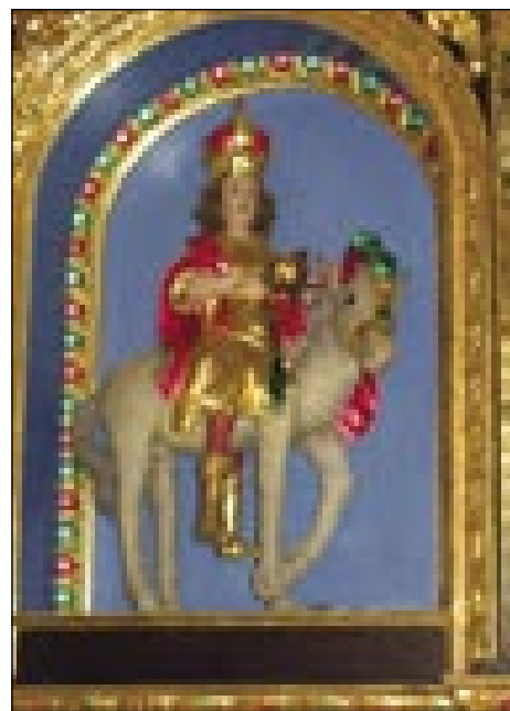
Sv. Martin na Svetih gorah