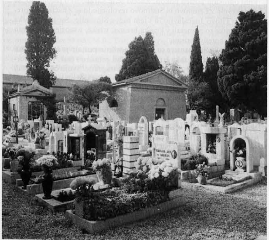
Vseh mrtvih dom... Ne samo rože na grobove...