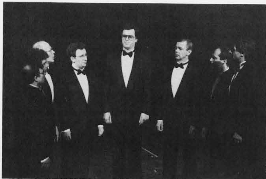
Tržaški okteti je doživel 16 nepozabnih dnevov med Slovenci v Argentini. Imel je deset celovečernih koncertov, pel pri mašah, imel celo vrsto priložnostnih nastopov. Nepozabna so bila srečanja, topli sprejemi, občudovanje naravnih lepot. Našim »ambasadorjem« čestitamo za ta velik dosežek