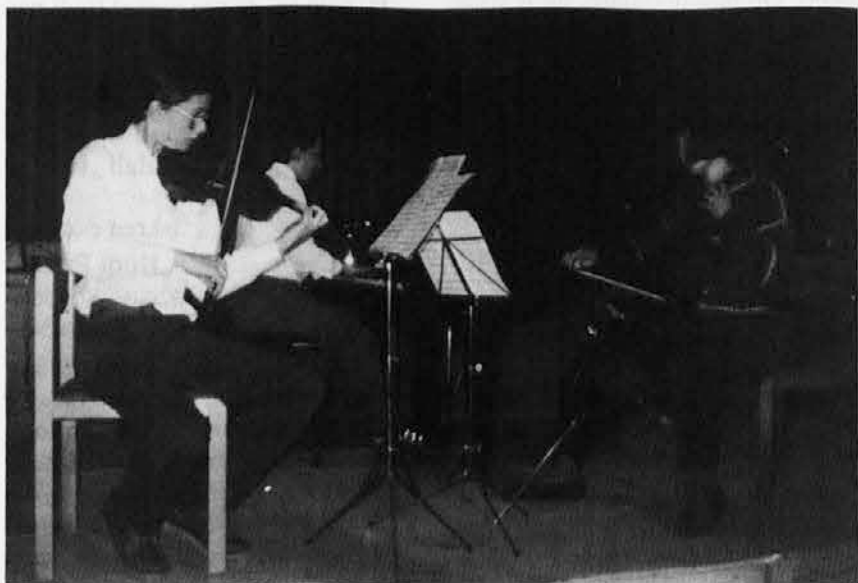
Klavirski trio SCGV »E. Komel« v Celovcu

Veseli čestitamo in želimo še obilnega blagoslova na mnoga leta!