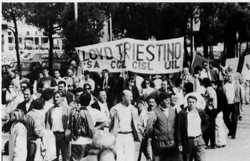
Prva zaposlitev, škedenjska železarna, arzenal, tovarna Velikih motorjev so še nerešeni problemi Trsta. Stavkajoči delavci opozarjajo nove politike!