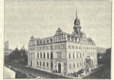
„Narodni dom“ v Mariboru.

Dr. Glančnika vidimo še v drugih narodnih društvih. „Čitalnico“ je rajnki zmiraj smatral za zbirališče vseh domačinov in tujcev. Dne 16. grudna leta 1894. je bil izvoljen njenim predsednikom, dasi se je branil, češ,