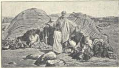
Kolibe pri Asuanu.

Slavno ime v zgodovini ima mesto Aleksandrija po svoji katehetski šoli; imenovala se je „aleksandrijska šola“ ter je bila veliko stoletij središče svetne in verske znanosti. Najnavedem vsaj imena nekaterih slovečih