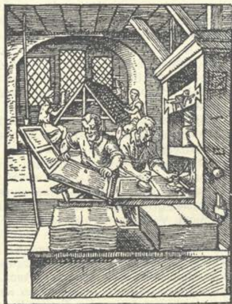
Tiskalni stroj Janeza Gutenberga.

Če bi pa mislili, da je ves tedanji omikani svet s slavospevi pozdravil Gutenbergovo iznajdbo, bi se bridko motili. Revez že itak ne zaupa novotarijam. Mogočnjakom se je pa zdelo kar „za malo“, da bo zdaj