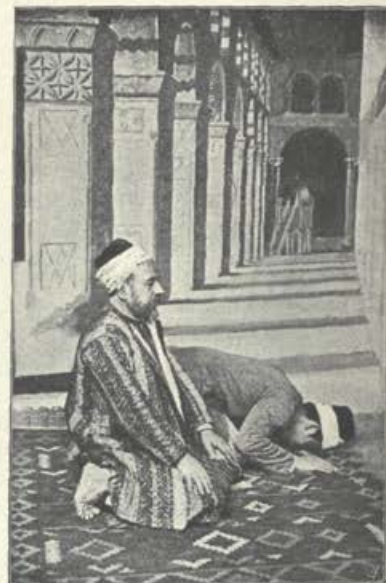
V turški džamiji.

S tem ogromnim številom Slovenk pa se ne more primerjati število Slovencev, ki so v Aleksandriji. Vzrok je ta, ker tukaj moški ne dobe tako lahko primerne službe kot ženske. Kolikor jih je prišlo sem in so se tu nastanili, so bili nekako osamljeni in zapuščeni tako v narodnem kakor v verskem oziru. Saj prejšnja leta niso imeli nikogar, ki bi zanje