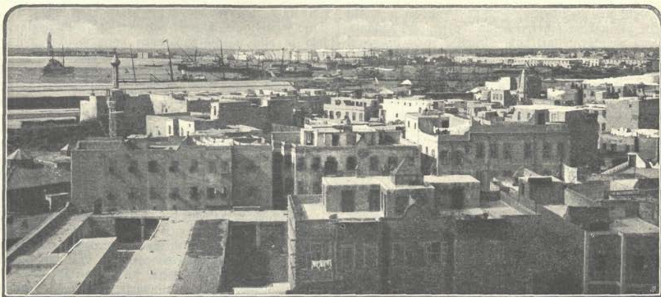
Aleksandrija. — Pogled na luko.