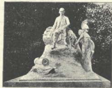
Zajčev osnutek Vegovega spomenika za Ljubljano.

Veličasten Vegov spomenik dobi kranjsko stolno mesto Ljubljana. Ljubljanski pomnoženi odbor marljivo nabira doneske, da čim preje uresniči svojo prelepo namero in okraši belo Ljubljano z mogočnim Vegovim