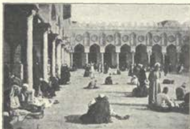
Turška višja šola.

Pa kjer stoji tempel posvečen Bogu, tam postavi tudi satan kapelo. Sovražnik vsega dobrega ni mogel toliko škodovati katoliški cerkvi v stoletjih, ko so kristjane očitno preganjali in ko so poganski oblastniki z ognjem in mečem hoteli zatreti krščansko ime, kolikor ji je škodoval z drugim orožjem, s krivimi verami. Teh je nastalo mnogo in se silno razširilo tudi v Aleksandriji. Najhujši krivoverci so pa bili arijani. Zoper nje se je najbolj boril škof aleksandrijski, sv. Atanazij, po pravici imenovan „Malleus haereticorum“ (kladivo odpadnikov). Sv. Ciril aleksandrijski se je pa slavno boril proti nestorijanom. Žalostni so bili časi za kristjane v Aleksandriji in sploh v Egiptu zlasti v 6. in 7. stoletju: strastna nasprotovanja med evthijani in melhiti, nesloga med kristjani, ki so trumoma odpadali od prave vere; bratomorni boji so naposled napravili lahko pot mohamedancem (Turkom), ki so prišli v Egipt in se ga polastili pod kalifom Omarom. Razume se, da se kristjanom, ki so še katoliški veri