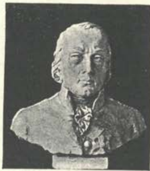
Vegov kip na realki v Idriji.