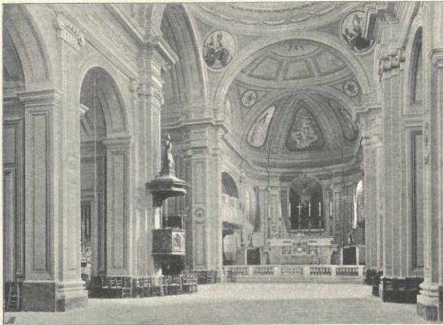
Cerkev sv. Katarine.

in na pravi poti. Kadar pa izveste in ste prepričani, da so zašle na kriva pota, pokličite jih pravočasno domov, kajti to je edin pomoček, da jih obvarujete pogube; ako bi vas ne hotele ubogati, pozovite jih po konzulatu domov, in ta bo tudi storil svojo dolžnost. Le na ta način, krščanski starši, jih boste obvarovali časne in večne nesreče, sebe pa žalosti in sramote, le tako boste enkrat lahko dali odgovor Bogu.