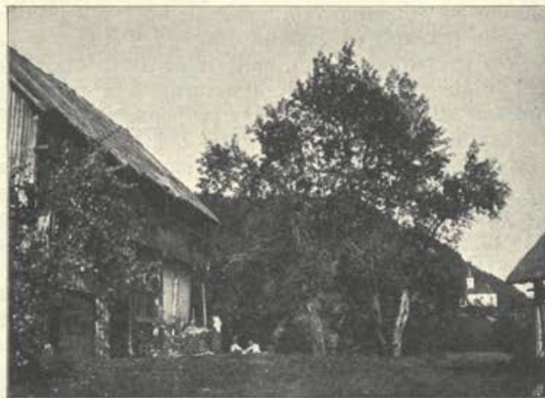
Vegov rojstni dom s cerkvico sv. Križa.

Mali Jurče zraste v zdravega, krepkega dečaka. V zgodnji mladosti pokaže pa tudi izredne duševne darove, s katerimi ga je obdarila v obilni meri priroda. Še dandanes živi med starejšim zagoriškim ljudstvom spomin, kako nenavadno brihten je bil mali Vehovčev Juri. Njegovi zanjki ni ušla nobena ptica. Kakemu starejšemu, bolj nerodnemu človeku se je rad zakadil med noge in švignil med njimi brzo naprej, ko je hotel ta kaznovati razposajenega mladiča.