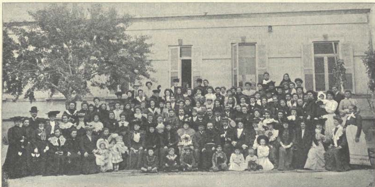
Krščanska zveza Slovenk.