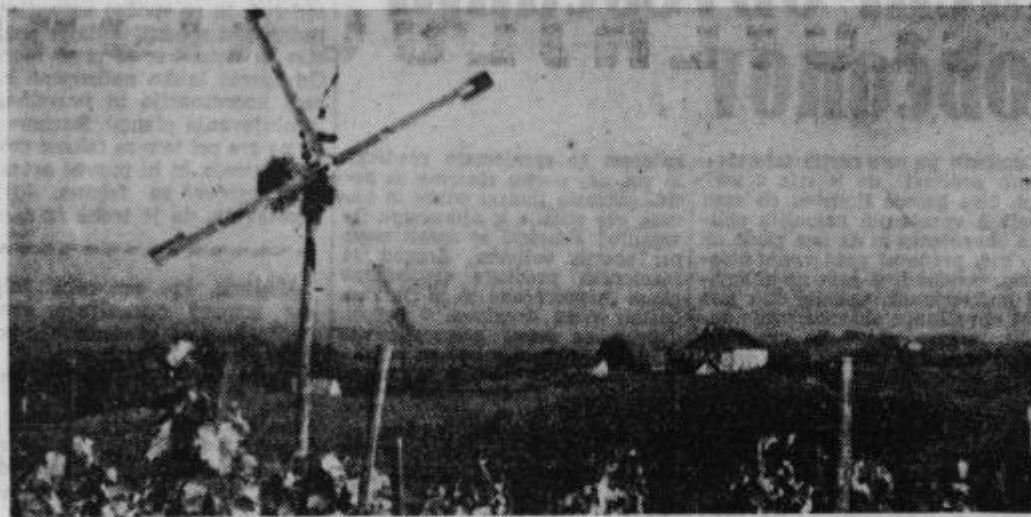
Zelezne dveri z okolico

Razstavo prihajajo gledat šole, kolektivi in posamezniki iz raznih krajev. Ker bo odprta le do 26. maja, ne zamudite priložnosti in si oglejte zanimivosti ormoške ilirske naselbine! V. K.