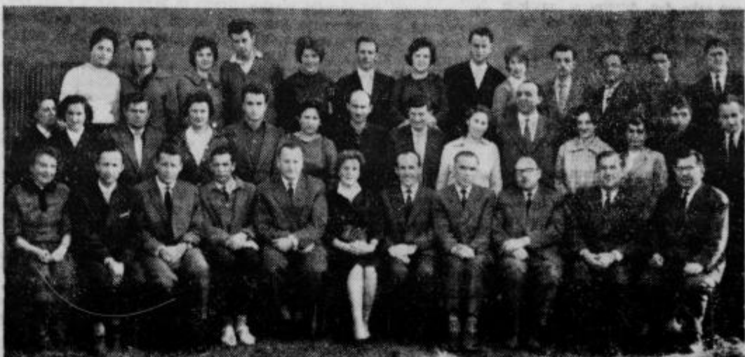
Ob zaključku sindikalne politične šole v Ptuj.

Za razvoj gospodarstva v ptujski komunah sta v povojnem času značilni dve obdobji. Do leta 1954 je še vedno prevladovala kmetijska proizvod-