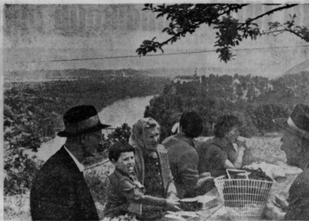
Krasen je razgled od Golovih v Gradšču pri Borlu na borlski grad ob Dravi

Letošnje skupno praznovanje 1. maja je poteklo v skupni želji, da bi imela sčasoma tudi Kungota svojo dvorano za družbene prireditve in proslave kot imajo take dvorane že po drugih vaseh. Iz leta v leto se družabnost bolj stopnjuje in povsod radi praznujejo ob dnevi, ko je praznovanje po vseh krajih naše domovine.