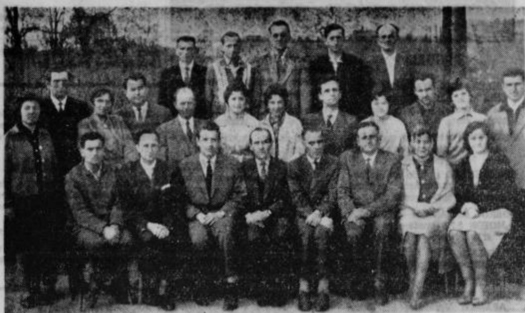
Ob zaključku sindikalne politične šole v Majšperku.