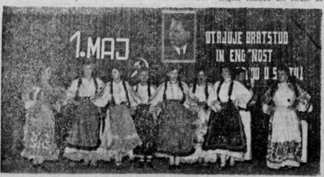
DPD »Svoboda« Varaždin je prispevala častni delez v letošnjem »Tednu bratstva in prijateljstva v Ptuj« v času med 23. in 28. aprilom 1962, in ki so ga organizirali občinski sindikalni sveti Čakovec—Varaždin—Ptuj. Enako srečanje bo v bližnji bodočnosti sledilo v sosednjih občinah in takrat bodo nastopali pri njih Ptujčani. Slika prikazuje nastop folklorne skupine DPD »Svoboda« iz Varaždina v Ptuj. Kontakt med nastopajočimi in občinstvom je bil prav prisočen.

Po vestih iz Španije je Portugalske vse bolj raste odpor proti tamkajšnjim diktatorskim režimom. To velja posebno v Španiji, kjer dirjajo delarske stavke, in v Portugalski, kjer so posebno agilni študenti.