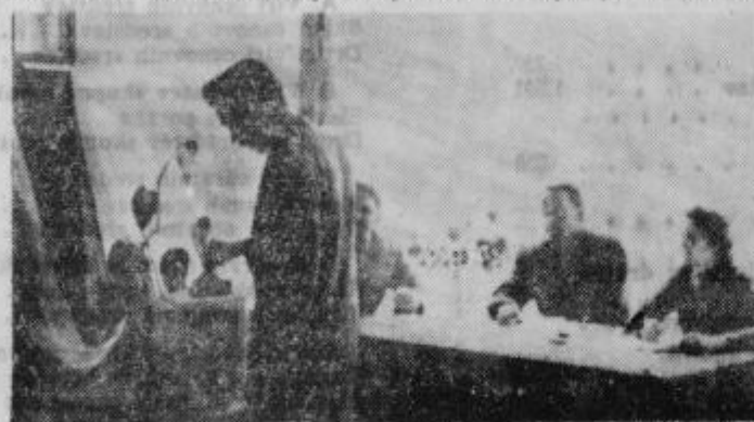
Na volišču v Ptujju

Do ustanovitve obratnih delavskih svetov po deloviščih, bo imel centralni delavski svet ogromno odgovornega dela ob vseh obstoječih predpisih in številnih priporočilih in predlogih članov kolektiva iz vseh delovišč. Novoizvoljeni delavski svet se bo moral glede na to sestajati po potrebi in po zbranih problemih. Dosedanj delavski svet, si je že dosele prizadeval ob krepki pomoči odbora sindikalne organizacije reševati glavne probleme, ni pa se mogel toliko posvetiti vsem delovnim in tankjšnjim problemom. To pa mu tudi ni bilo drugič mogoče, ker je bil sestavljen predvsem iz članov, ki so bili zaposleni na najbližjih deloviščih,