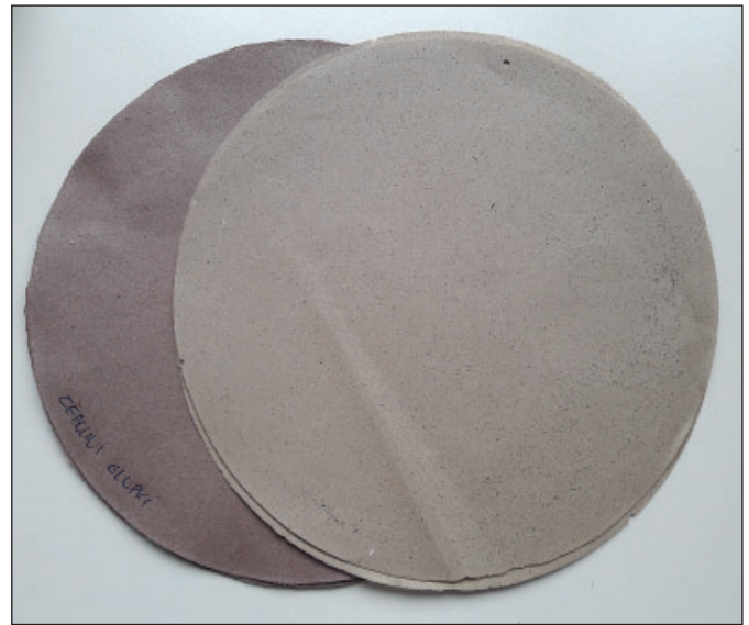
Slika 4: Laboratorijski vzorec papirja iz zunanjih suhih čebulnih luskolistov (levo) in oljčnih listov in vejic (desno)

Znano je, da cel svet stremi k trajnostnim rešitvam na različnih področjih, kot je tudi papirno predelovalna industrija. Preliminarni rezultati naše raziskave so pokazali potencial za uporabo alternativnih vrst biomase na področju trajnostne embalaže in papirne galanterije, predvsem na področju gostinstva in turizma. Obseg takšne proizvodnje je majhen in zato izvedljiv tudi s strani vhodne surovine, v našem primeru so to agroživilski ostanki. Z uporabo rastlinskih ostankov ali dodajanjem rastlinskih ostankov celulozi so nastale tudi zanimive in privlačne barve in teksture, ki zagotavljajo lastnosti, ki lahko izboljšajo videz in občutek, kar je še posebej dragoceno za specialne papirje.