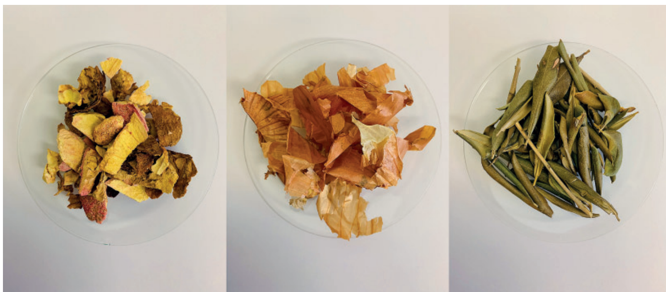
Slika 1: Olupki granatnega jabolka, zunanji suhi čebulni luskolisti in oljčni listi, vejice Figure 1: Pomegranate peels, onion skins and olive leaves

pine granatnega jabolka, listi oljk) in proučiti vidike, ki bi omogočili njihovo kaskadno uporabo (tj. izkoriščanje ekstraktov za hrano ali drugo uporabo na prvi stopnji, ki ji sledi preoblikovanje v nove materiale).