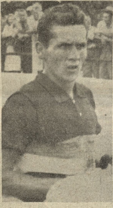
Veselin Petrović per il numero e la qualità dei partecipanti, non ha precedenti nelle competizioni passate.