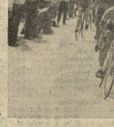
I corridori sulle rampe della Chiesa nel 1938