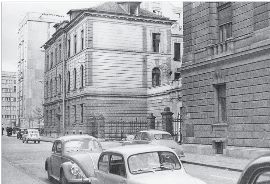
Pogled s Cigaletove ulice na delno porušeno poslopje zapora, v ozadju že stojijo nove stanovanjske in poslovne stolpnice (foto: Viljem Zupanc, hrani: SI ZAL LJU 342).

vi pa so porušili. Zlasti v literaturi se kot letnica rušenja pogosto pojavlja leto 1952, kar s časovnega vidika ni mogoče, saj so stavbo na Miklošičevi še vedno uporabljali kot preiskovalni zapor, kazensko poboljševalni dom ter zapor za prestajanje kazni zapora oziroma strogega zapora, 153 nato pa so v del izpraznjene stavbe namestili okrajni zapor. Glede na pregledane in predstavljene vi-re je bolj verjetno, da so stavbo porušili v začetku šestdesetih let. 154