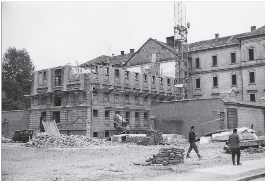
Rušenje zaporniškega dela za sodno palačo, pogled s Pražakove ulice.

ukrepi za oblikovanje samostojnega zavoda na Igu so vključevali postavitev žične ograje okoli poslopja, zamenjavo vrat in ključavnice na sobah obsojencev ter izdelavo in namestitev rešetk na hodnikih in glavnih vratih. Prav tako bi morali urediti prostore za delavnice, zgraditi paviljon za obiske in garažo za avtomobile, urediti sušilnico in dezinfektor za perilo, preurediti kuhinjo in vanjo namestiti enega od velikih kotlov za kuhanje hrane iz KPD Ljubljana ter v sobah obsojencev namestiti nove železne peči na žagovino in kabine za stranišča. Od vseh del je bilo najbolj nujno urediti ograjo okoli poslopja in kuhinjo. Načrtov za grajsko poslopje ni bilo, zato so nameravali zaposliti enega od obsojencev, da jih izdelata. Ocenjevali so, da bi imel preurejeni KPD Ig kapaciteto od 500 do 550 obsojencev. 146