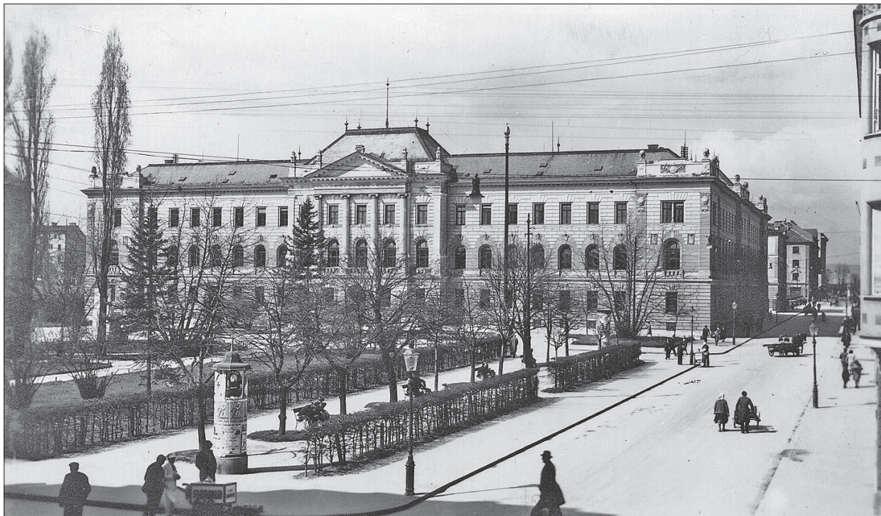
Današnji Miklošičev park z monumentalno sodno palačo v ozadju na razglednici, nastali okoli leta 1934.

Ko je kazenske ustanove prevzelo Ministrstvo za notranje zadeve LRS, so bile razmere v njih zelo slabe, zlasti v smislu prevelikega števila jetnikov in premajhnih kapacitet za njihovo ustrezno