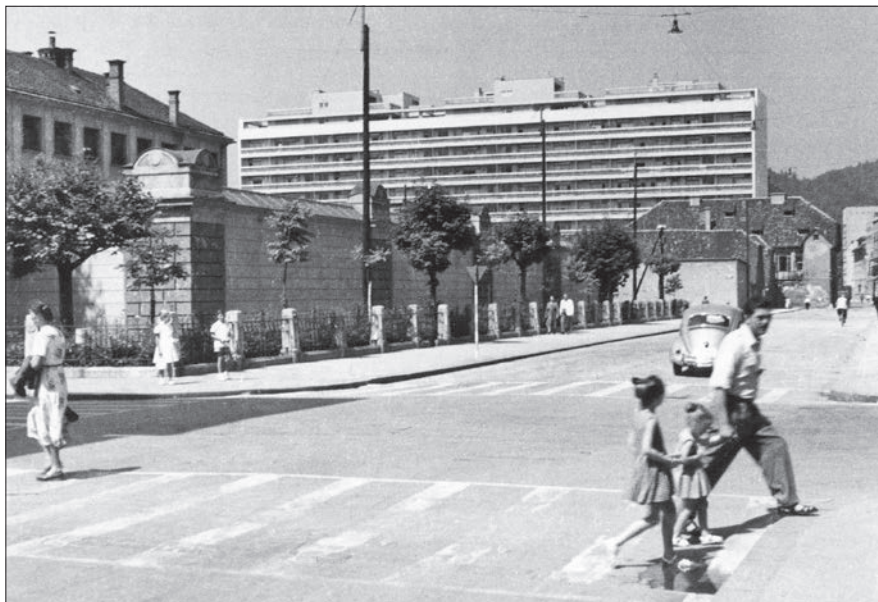
Pogled na zidano ograjo okoli KPD Ljubljana s Pražakove ulice, okoli leta 1959. V ozadju je poslovno-stanovanjski blok Kozolec, ki je bil zgrajen med letoma 1955 in 1957 (hrani: SI ZAL LJU 342).

pozidali nove dimnike, prebelili vse notranje prostore in izvedli še nekaj drugih manjših del. Pri bivalnih razmerah obsojencev zopet ni bilo večjih sprememb. Še vedno je primanjkovalo postelj, slamaric, rjuh, odev, oblačil in obutve. Od vseh kazensko poboljševalnih domov je bilo higiensko stanje najslabše prav v Ljubljani, in sicer zaradi prenatrpanosti celic, pomanjkanja posteljnine, perila in oblek za obsojence ter pomanjkanja čistilnih sredstev in sušilnice za perilo. Vedno več slamaric naj bi bilo tako zastarelih in obrabljenih, da jih ni bilo mogoče uporabljati. Zavodski prostori poleg tega niso bili ogrevani. Težave pri oskrbi s hrano so se nadaljevale, zato je kalorična vrednost obrokov ostajala nizka. 64