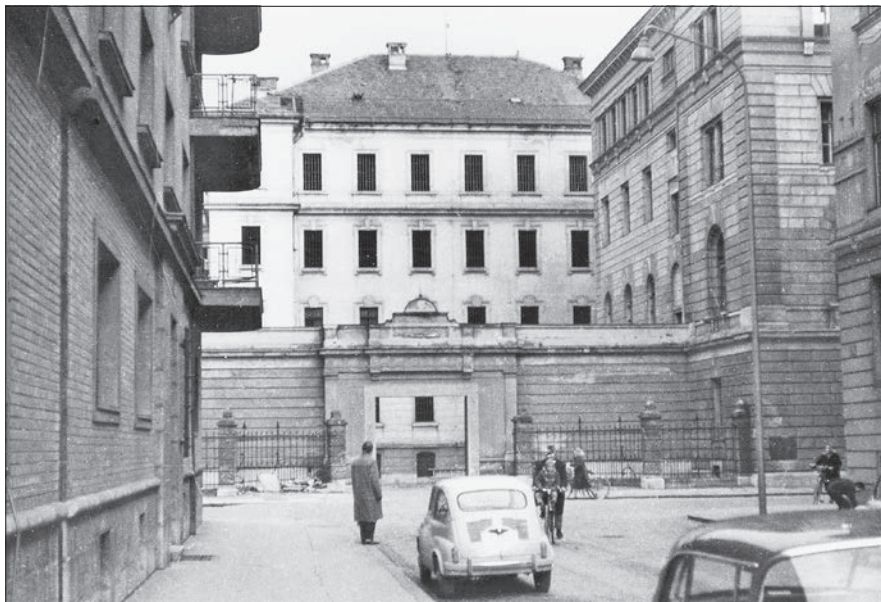
Pogled na stranski vhod v stavbo KPZ Ljubljana v Cigaletovi ulici.

prezidali za prilagoditev vsakokratnim potrebam institucije. Zunanje fasade so bile prvotne, zidove naj bi bilo v dobrem stanju. Ne glede na vse našete pomanjkljivosti so v zavodu konec leta 1946 predvidevali, da bi lahko bila stavba uporabna še nadaljnji dve stoletji. 26