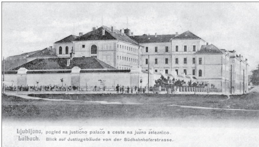
Razglednica s podobo sodne palače – pogled s severne strani, kjer se lepo vidi zaporniški del stavbe.

Sodni zapor je bil zasnovan kot preiskovalni zapor in zapor za prestajanje krajših zapornih kazni. Šlo je za ustanovo mešanega tipa, v zaporu so bili namreč tako moški in ženske kot mladoletniki. V trinadstropni stavbi je bilo 73 posamičnih celic in 42 celic za štiri do šestnajst obsojencev, ki so bile razdeljene na enajst oddelkov. Zapor je lahko sprejel od 290 do največ 380 oziroma 400 obsojencev. Poleg celic so bili v zaporu skupni prostori: kopalnica s šestimi tuši, kopalnica s