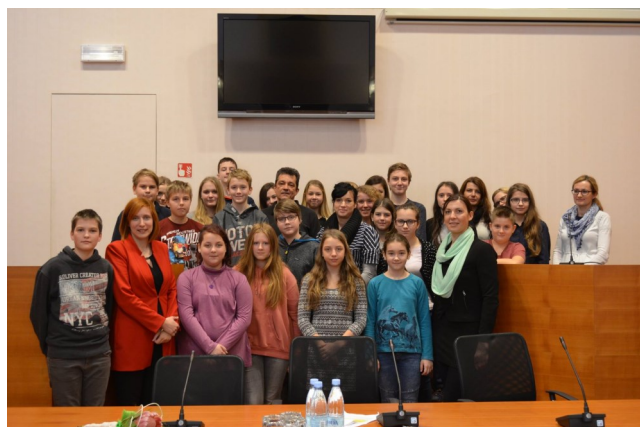
Občinski otroški parlament 2017

V mesecu februarju smo na DPM Trbovlje izpeljali številne aktivnosti za otroke. Vsako sredo popoldan poteka Sožitje generacij - ustvarjalnice, ki so namenjene tako otrokom, kot njihovim staršem, starim staršem. Vsak četrtek se otroci likovno izražajo na Kreativnih uricah, konec meseca februarja pa smo končno pričeli tudi s torkovim vrtilkanjem. Poleg vseh popoldanskih aktivnosti pa smo že izvedli tako šolske, kot tudi občinski otroški parlament. Tudi čez vikend nam ni dolgčas. Takrat se, poleg rojstnodnevni animacij, z vilinko Trobentico odpravimo na čarobno popotovanje in spoznavamo zanimiva glasbila in zvoke. Nedelja, 26. februarja je namenjena pustnemu sprevodu s pustnim rajanjem. Februar pa zaključujemo s počitniškimi dejavnostmi, ki bo tudi tokrat za otroke kar precej pestre.