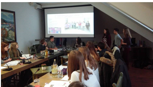
Medobčinski otroški parlament v Ljutomeru.

Predstavniki ZPMS so se zaenkrat udeležili dveh parlamentov: medobčinskega v Ljutomeru in mestnega v Ljubljani.