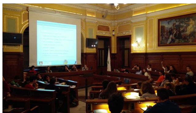
Mestni otroški parlament v Ljubljani.