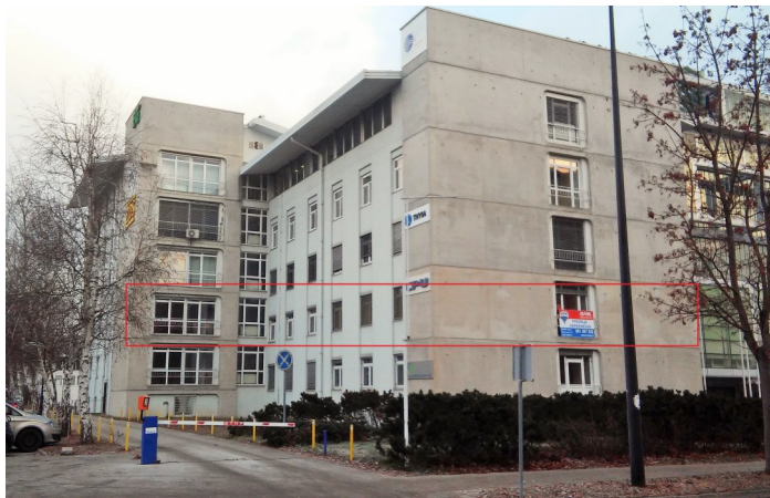
Naši novi prostori so v 1. nadstropju. Vhod v stavbo je z zadnje strani. Fotografirano z Dimičeve ulice.

Zveza prijateljev mladine Slovenije je konec lanskega leta kupila poslovne prostore na Dimičevi ulici 9 v Ljubljani. V mesecu januarju in februarju smo prostore preurejali, med 16. in 19. marcem 2017 pa bo potekala selitev. V teh dneh bomo po vsej verjetnosti nedosegljivi oz. ne bomo imeli dostopa do e-pošte. ZPMS bo začela uradno poslovati na novi lokaciji s ponedeljkom, 20. marca 2017.