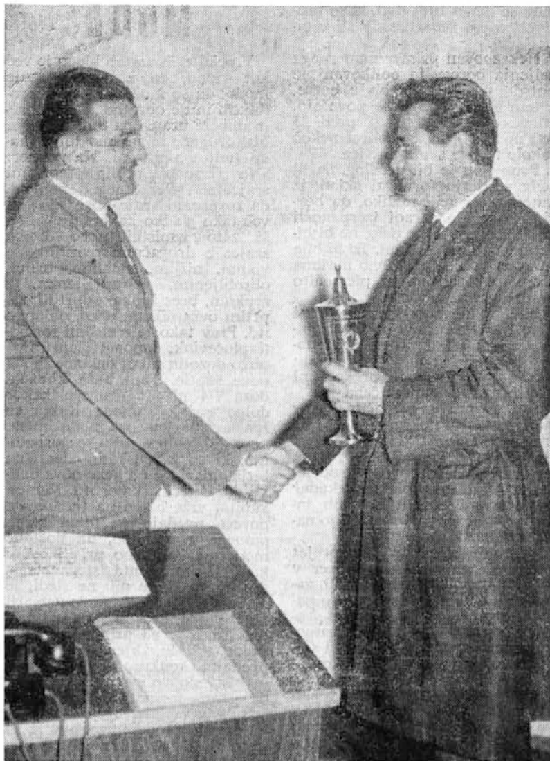
Se kaj takšnih rezultatov