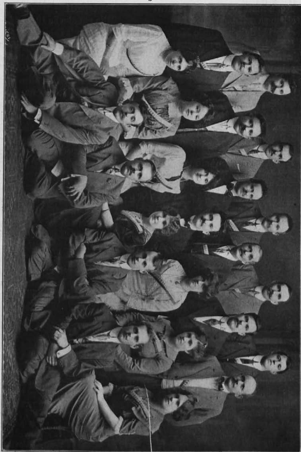
Slov. pevsko in dramatično društvo „Domovina“ v New Yorku, N. Y.