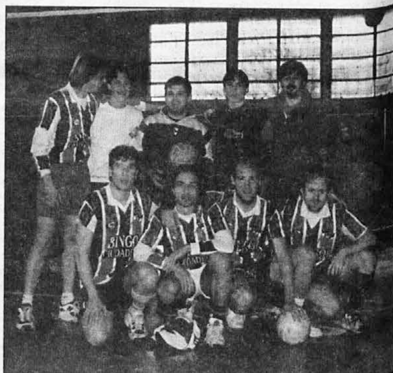
Fantovska ekipa iz San Martina