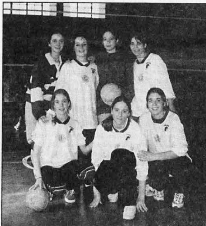
Ekipe deklet iz San Justa