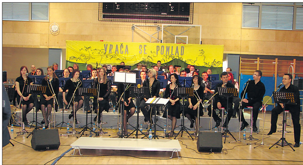
Koncert Mestnega pihalnega orkestra Radlje ob Dravi z vokalno spremljavo markovskega komornega zbora Kor ter vokalnih solistov.

beni spremljavi 30-članskega orkestra izvedli odlični vokalni solisti, prvi nastop pa je zabeležil tudi novoustanovljeni markovski komorni zbor Kor. Zbor je naslednik vokalne skupine Kor in deluje pod okriljem KUD Markovski zvon. Po sedmih letih „zorenja“ želijo izpopolniti vrzeli, ki nastajajo v manjših zasedbah in zazveneti v vsej