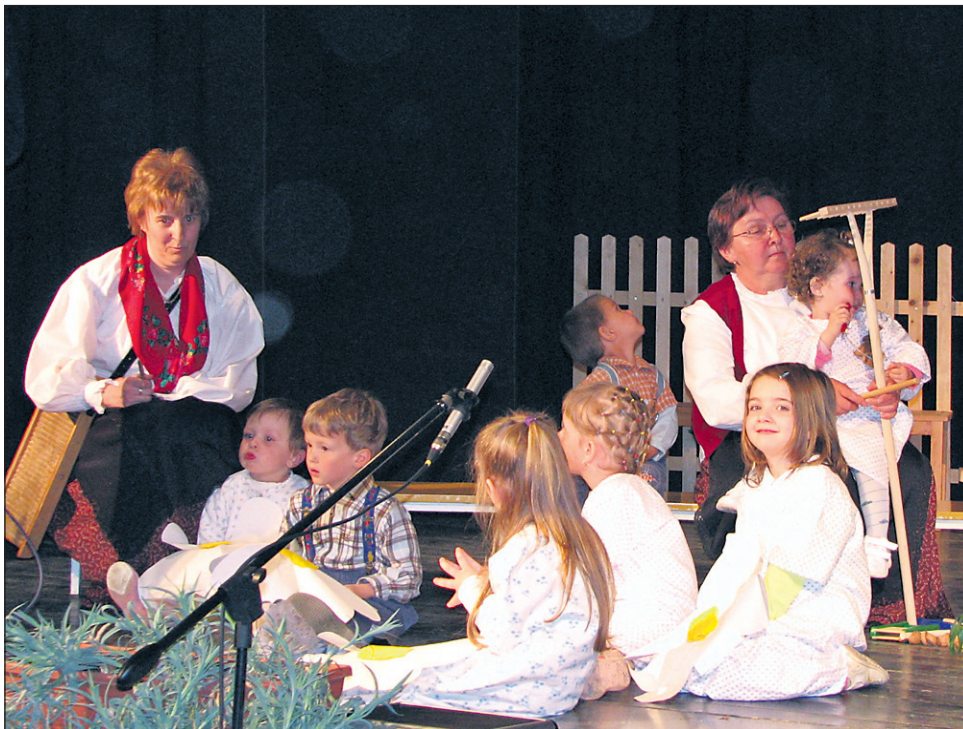
Najprej so se predstavili najmlajši s svojimi vzgojiteljicami.

ca, nosijo zanimivo ime. Na vprašanje, kaj pomeni, so povedali: »Ja, lahko pomeni, da popijemo tričetrt litra vina, da nas lahko čakate tričetrt ure ali pa da igramo v tričetrtinskem taktu.« Skupaj muzicirajo že 13 let, kljub temu da so že v pokoju, obiskujejo glasbeno šolo in ljudska glasba je njihov hobi. Igrajo na klarinet, diatonično harmoniko, bas, kitaro in ribež. Iz-