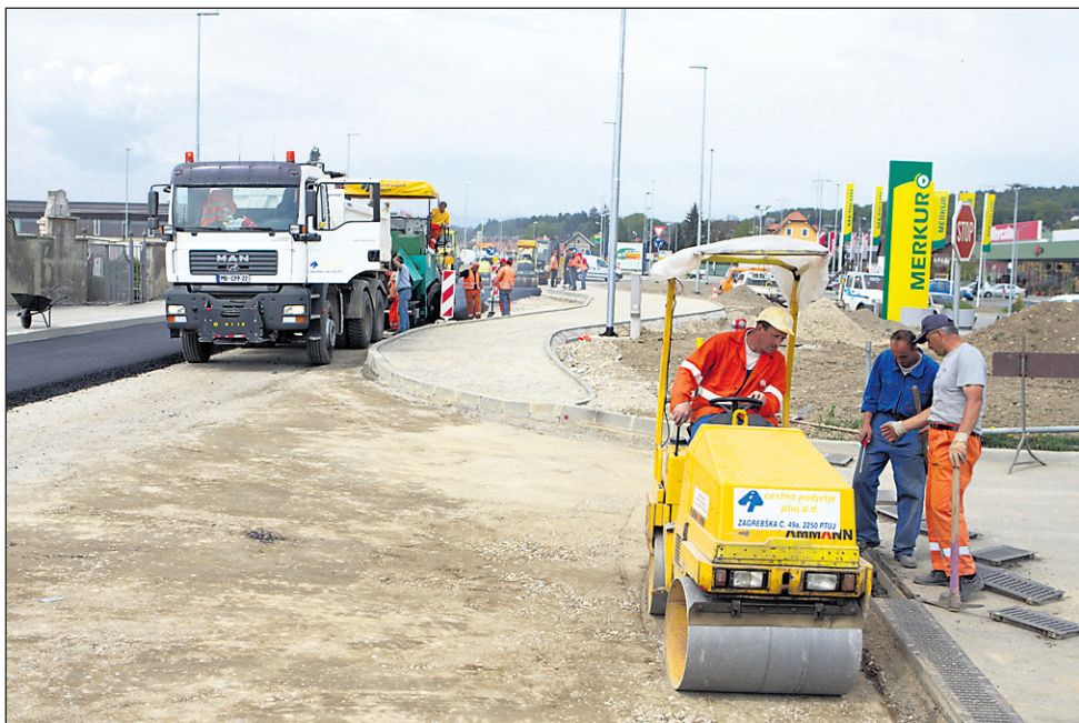
Cestišče na Dornavski bodo končali do odprtja Puhovega mostu, ostala dela pa do konca maja.

Razlogi, ki so postali sedaj argumenti za sklenitev aneksa, niso nekaj novega. Zaplete z zemljišči so v MO Ptuj «predvideli», da bo do njih prišlo, so opozarjali že pred začetkom del. Med potekom gradnje pa v MO Ptuj niso imeli sprotnih informacij o nastalih zapletih, kljub temu da je soinvestitorica v višini 42 od 166 milijonov tolarjev, kolikor naj bi investicija stala glede na sklenjeno prvotno pogodbo. Ali aneks znesek povišuje, niso povedali, čeprav gre za javna sredstva; v javnost so prišli le podatki o podaljšanju roka izvedbe.