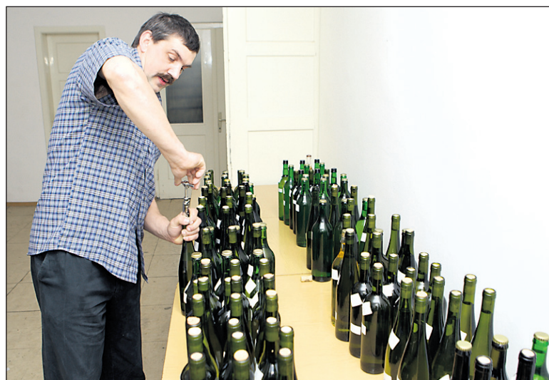
Od 69 vzorcev so bili izločeni samo trije.