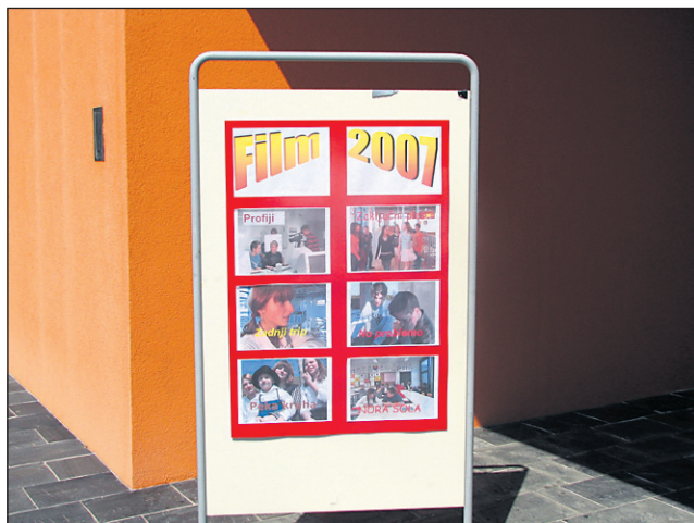
Na prvi osnovnošolski filmski festival so vabili takšni plakati.