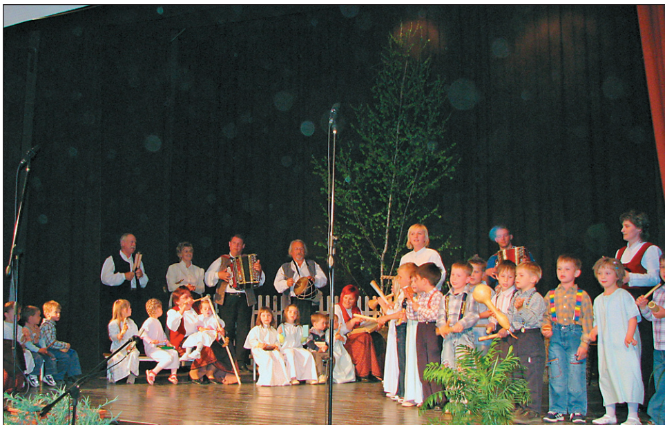
Gostitelji Porini pa počini so zaigrali skupaj z otroki iz vrtca, ki so porok za to, da bo ljudsko izročilo živelo tudi v bodoče.

Gostje iz Avstrije, prišli so iz Bärnbacha, ki leži okrog 40 kilometrov zahodno od Grad-