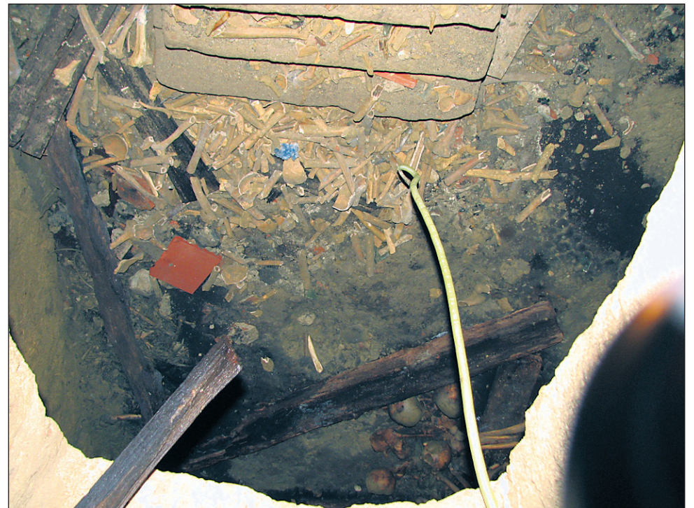
Stopnice v grobnico so prekrite s kupi človeških kosti.