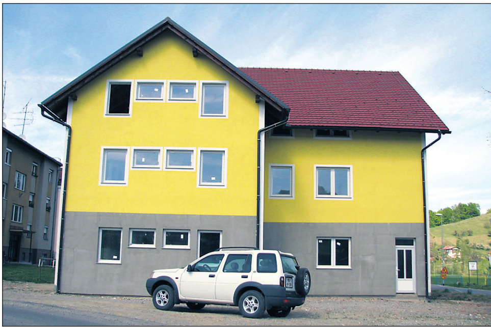
V pritličju nove večnamenske stavbe v centru Leskovca ima nove prostore, zelo primerne za ambulanto, domače TD Klopotec. Bi jih društvo bilo pripravljeno zamenjati za prostore sedanje ambulante?!