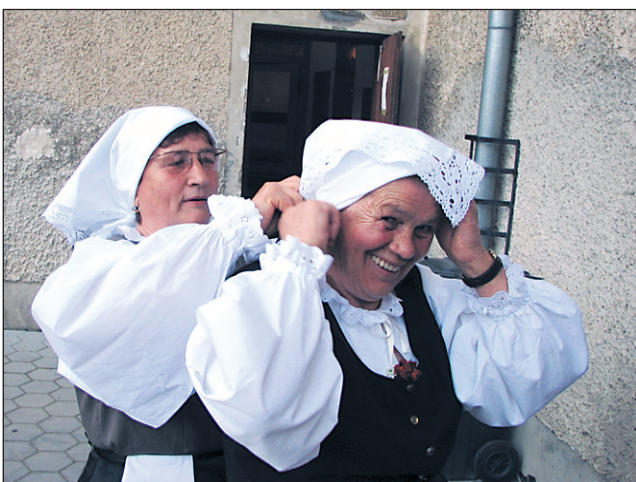
Pred nastopom si je bilo treba nadeti vso opravo in pomoč je bila pri tem dobrodošla ...