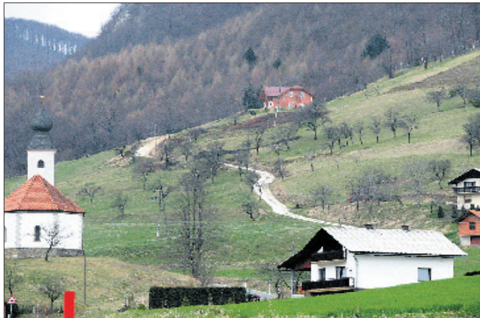
Z državnim sofinanciranjem naj bi še štiri kilometre videmskih cest dobilo asfalt.