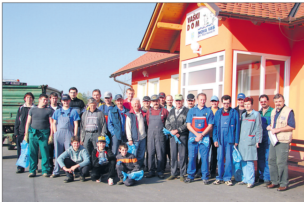
Udeleženci skupne čistilne akcije v Novi vasi, ki so čistili območje ob reki Dravi, kjer je urejena tematska pot.