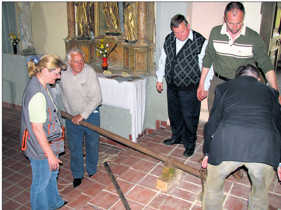
Takole, z vzvodom, so se fantje (neuspešno) lotili dvigovanja grobnične plošče.