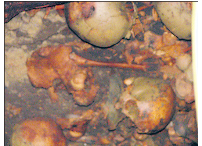
Skozi lino na plošči se je lahko videl del notranjosti skrivnostne grobnice; na sliki (čeprav nekoliko nejasno) so vidne lobanje umrlih, ki jih je pričakovati še več.