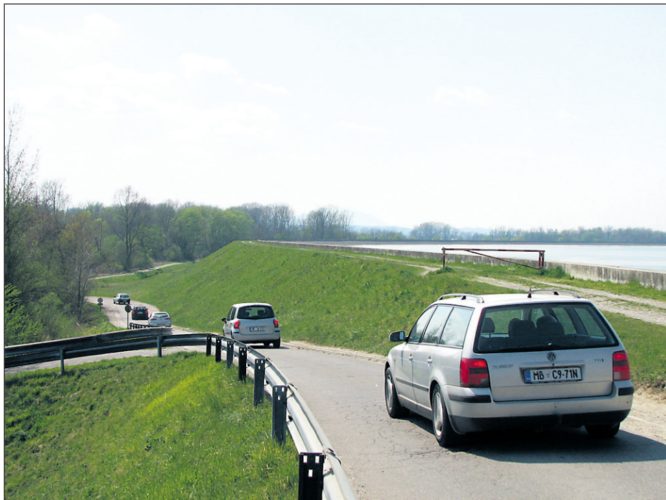
Z umestitvijo hitre ceste po „obkanalski varianti“ naj bi se precej zmanjšal sedaj gost promet čez jez po šturmovski cesti

Župan Bračič je na zahtevo Rožmana odgovoril, da se bo