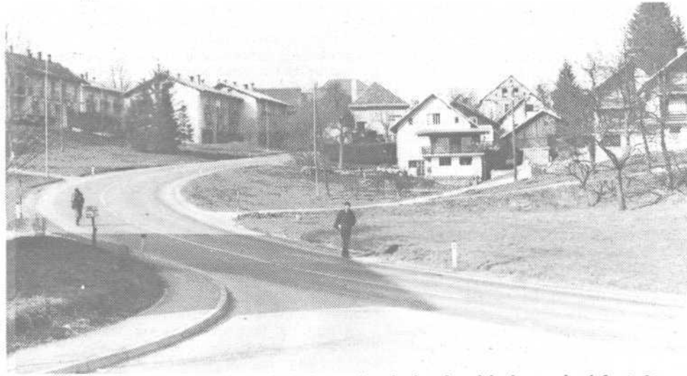
Velikolaška panorana: Kulturno in zgodovinsko razgiban kraj, toda s slabo komunalno infrastrukturo