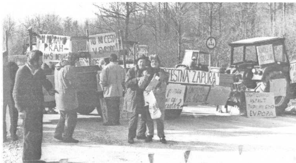
K cestni zapor ni bilo predstavnikov občinskih, mestnih in republiških cestnih oblasti. Kaj bodo morali Rakičani še storiti, da bodo dobili obljubljenih 7 kilometrov asfalta do Preserja?