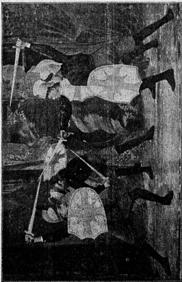
Mladci-vitezi se bore.