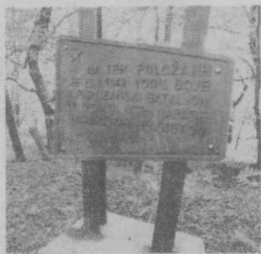
Obeležje na Pugledu

Ob cesti, ki pelje v Šentpavel, je tudi cesta v Brezje in Repče, vasi, ki spadata v KS Lipoglav. Cesta je zelo slaba in v zimskem času neprevozna, zato raje uporabljajo tisto, ki pelje skozi Panško