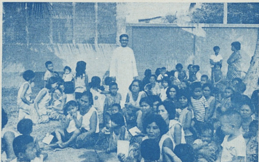
Tajski domači duhovnik med družinami, ki čakajo na božični dar v Bangkoku pri fari sv. Jožefa, kjer je cerkev naših uršulink.

seda misijoni jih povsod vžiga. Srečo, ki nam jo prinaša vera, žele posredovati bratom drugih ras. Ker sami ne morejo ponesti blagovesti mednje, v misijonarju pozdravljajo in izražajo to svojo pripravljenost. To sem močno povsod doživljala.