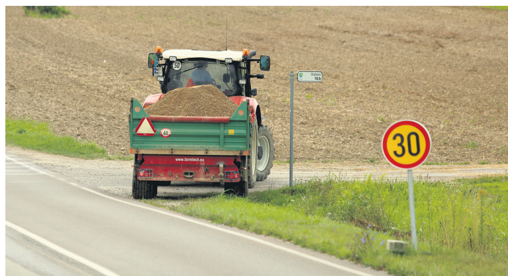
Kmetje morajo pred vključevanjem na asfaltno cesto očistiti zemljo s koles traktorjev in druge strojne opreme.

V Stopercah (občina Majšperk) pa niso traktorska kolesa in druga mehanizacija najbolj blatni samo zaradi vožnje po njivah, ampak