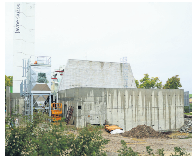
V kurilnici na Volkmerjevi cesti vgrajujejo nov biomasni kotel. Dela bodo predvidoma končali novembra.

Čeprav je glavna kurilnica, iz katere Javne službe (JS) Ptuj ogrevajo blokovska naselja in objekte javnega značaja (bolnišnico, zdravstveni dom, šolski center ...), v remontu, so že začeli ogrevati.