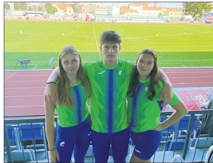
Trojica članov AK Ptuj je nastopila na reprezentančnem tekmovanju na Češkem.