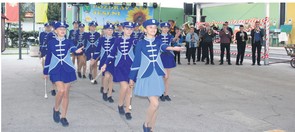
Nastop mažoret in godbenikov iz Male Subotice

Prireditev Pozdrav jeseni, ki sta jo organizirala Turistično društvo (TD) in občina Starše, je pritegnila lepo število obiskovalcev. Vsi so bili pogoščeni z odličnimi lokalnimi kulinaricnimi dobrotami, ki so jih pripravila domača društva in drugi ponudniki.