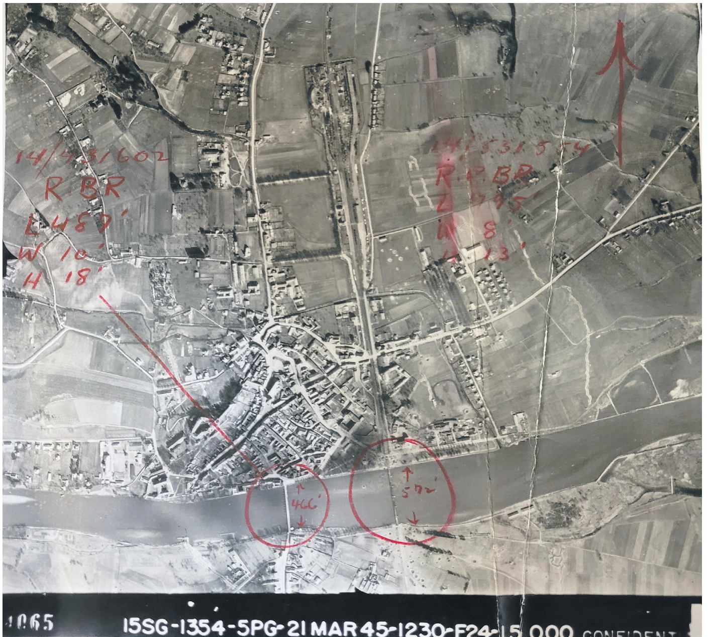
Izvidniški posnetek iz 21. marca 1945, ki prikazuje bombne kraterje okoli obeh ptujskih mostov, še posebej okoli železniškega.

Kar je bilo, je bilo, vojna pač terja svoj davek. Poškodovano infrastrukturo, tudi bližnjo Mladiko, ki so jo zadele bombe, namenjene železniškemu mostu, in povsem uničile ostrežje in mansardo stavbe, prizanesle pa niti drugemu