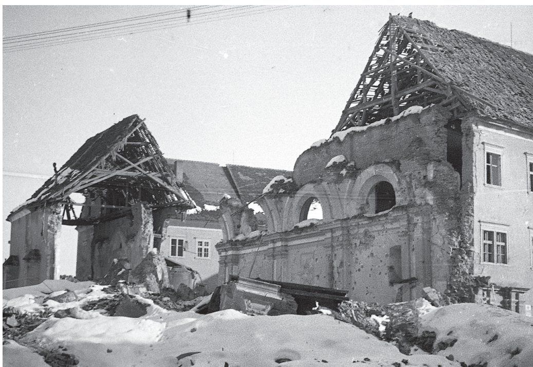
Poškodovani minoritski samostan

nadstropju, so po vojni obnovili, manj ali nič pa je znanega, koliko neeksplodiranih bomb jim je uspelo odstraniti. »Če upoštevamo statistiko, ki pravi, da se ni aktivirala vsaka sedma britanska bomba, to pomeni, da jih iz prvega napada ni eksplodiralo 18, iz drugega pa 57. Potencialno imamo torej 75 bomb, ki lahko še vedno ležijo zasute med stebri, pod novogradnjami, v Dravi in po okoliških njivah, kar predstavlja veliko nevarnost pri vsakem gradbenem posegu pa tudi pri morebitnem potresu. V izogib nesrečam in stroškom ob evakuacijah bi bilo po moje pametno narediti pregled, kam točno so padle bombe, kar se da na osnovi zavezniških podatkov in posnetkov, nato pa tista območja ustrezno zavarovati,« je poudaril sogovornik.