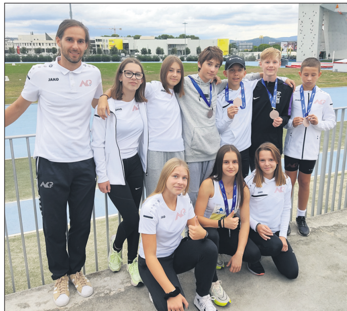
Pionirska zasedba AK Ptuj na tekmovanju v Kopru