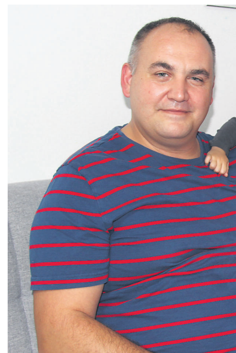
Družina je pri usakdanjem življenju zelo dne okužbe ali poškodbe.

Letos spomladi je šla družina z Mio na pregled v Bruselj. Tam so jo podrobno pregledali in svetovali, da bodo opravili tako imenovano skleroterapijo. „To pomeni, da jo večkrat, tudi do 80-krat, vbodejo