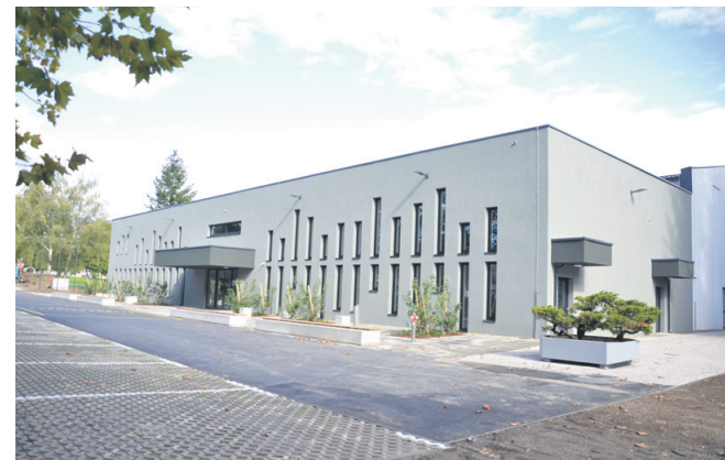
Slavnostno odprte prenovljene in dograjene športne dvorane Slovenska Bistrica je bilo v sredo, 28. septembra.

V Slovenski Bistrici so ta teden slavnostno odprli vrata prenovljene in dograjene športne dvorane. Na Ptujju je bila z občinskim denarjem nazadnje zgrajena Športna dvorana Ljudski vrt, leta 2006, torej pred 16 leti.