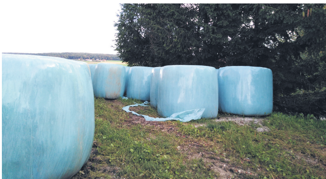
Prevzem folije v CERO Pragersko je za kmetovalce iz občine Slovenska Bistrica brezplačen. Stroške, ki bodo nastali pri zbiranju, bo pokrila občina Slovenska Bistrica.