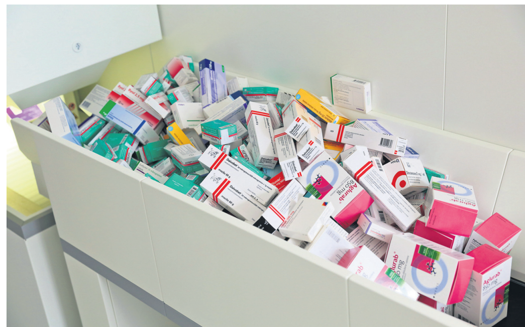
Lekarniška zbornica Slovenije opozarja na nasprotujočo si zakonodajo na področju nabave zdravil.

Na ministrstvu za zdravje so zagotovili, da se bodo lotili iskanja sistemskih rešitev na področju nabave zdravil. Prvi korak je današnji sestanek (v petek) s predstavniki Lekarniške zbornice, na katerem bodo skušali najti skupni jezik in najboljše ter najhitrejše možnosti odprave zakonskih naskladij.