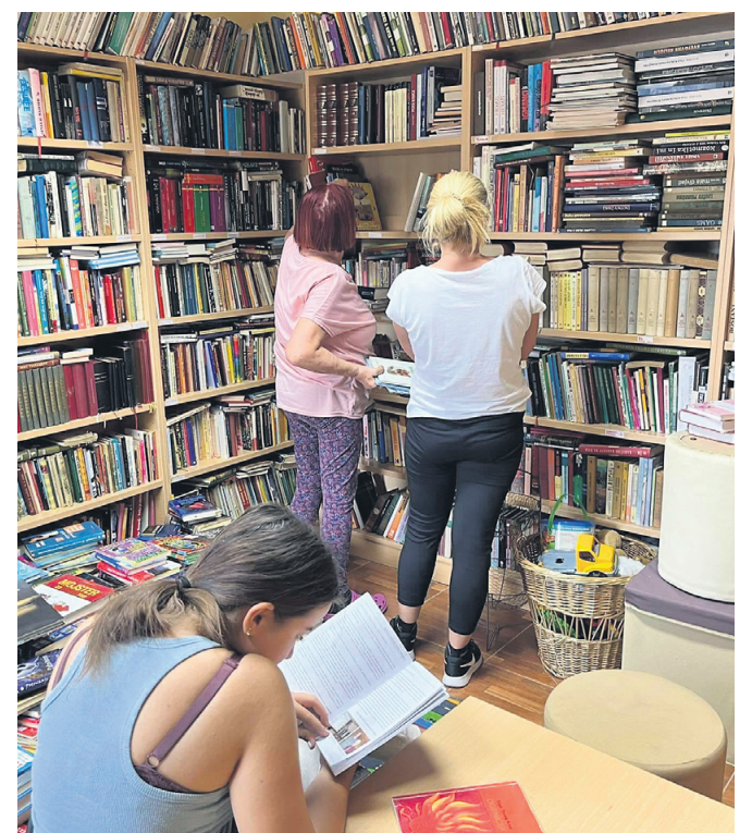
Približno 7.000 enot gradiva prostovoljci ob popoldnevih in koncih tedna selijo v nove knjižnične prostore.

Stari prostori so knjižnici KUD Vitomarci služili vse od leta 1970, zadnja leta pa so postali pretesni. Tudi novi niso veliki, merijo zgolj 30 kvadratnih metrov, a so grajeni namensko in bodo zadoščali za potrebe knjižnice. Občina se je s projektom Vitomarci včeraj in danes, ki vključuje tudi pridobitev novih prostorov za knjižnico, preko Lasa Ovtar Slovenskih goric prijavila na razpis za pridobitev