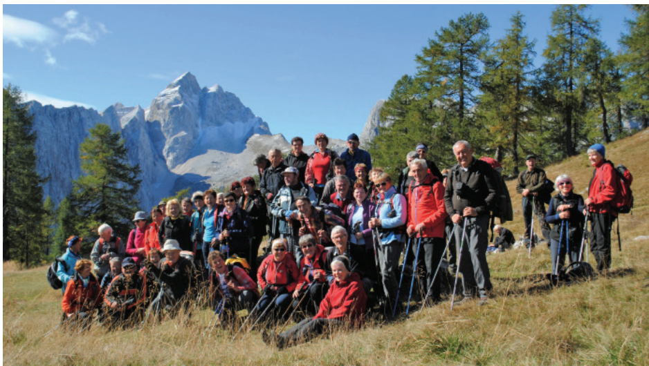
Izletniki PD na Slemenu nad Vršičem.

Vodniški odsek tvori skupina 16 planinskih vodnikov z ustrezno licenco, pridobljeno v postopku izobraževanja po verificiranem programu PZS. Vodenje opravljajo v lastnem PD in za vse skupine brezplačno. Z letnim programom predstavimo planinske izlete, ki jih predlagajo planinci in planinski vodniki. Izletov je v PD v dveh skupinah upokoencev, sekcijah LTH Castings, Knaufinsulation in Društvu Projekt Človek že nekaj let okrog 100.