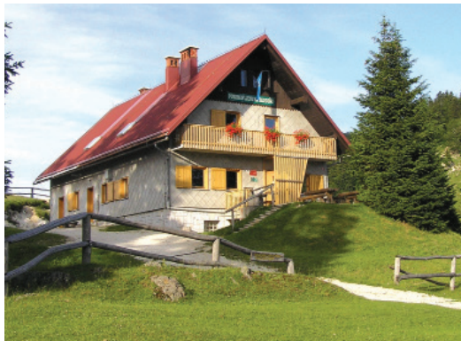
Koča na Blegošu.

Odprtje obnovljenega doma je bilo 2. 10. 2010.