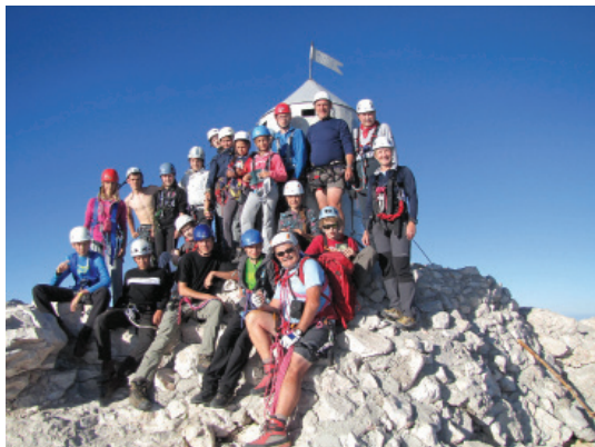
Izlet osnovnošolskih planincev na Triglav.

ga leta na različnih lokacijah v sredogorju, bivajo v planinskih kočah. Več o taborih lahko izvemo v biltenih, ki izidejo po vsakem taboru, kjer upravičijo tudi stroške in namensko pridobljena sredstva občinskega proračuna.