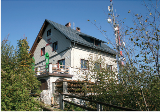
Dom na Lubniku.