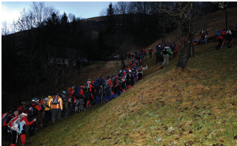
Spominski pohod s Pasje ravni v Dražgoše.

uspešno izvedbo dosedanjih pohodov. Spominskega pohoda sta se v preteklih letih udeležila dva predsednika RS – Milan Kučan in Borut Pahor.