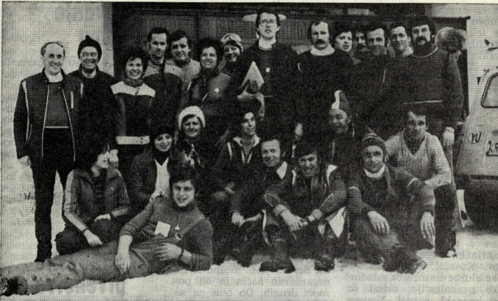
Naša ekipa na letošnji tekstiliadi