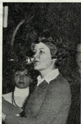
Ob prazniku smo sodelovali tudi v kulturnem programu

enotnosti naših narodov in narodnosti, na tesno povezanost z ljudstvom, kar je bilo v odločilnih trenutkih narodnoosvobodilnega boja vselej najuspešnejše orožje — je tudi danes podlaga za vse naše uspehe in njih ohranitev.