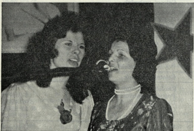
Naši mladinki v pevski točki