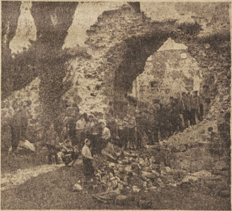
Mladina ob spomeniku naše NOB: v letošnjem jubilejnem letu, ob 20-letnici ljudske vstaje narodov Jugoslavije, so šole izdelale programe, katere kraje, znane iz časov NOB, bo mladina obiskala in se srečala s spomeniki in nekdanjimi borci. Na sliki: ekskurzija na kraju slavnih bojev na Turjaku

Glede dejavnosti Sveta za šolstvo v preteklem letu je bilo poudarjeno, da je bilo delo zelo obsežno, vendar pa morda nekoliko preveč angažirano pri pripravi različnih osnutkov in predpisov. V prihodnje bo poskušal Svet posvetiti več časa obravnavanju prečihtih problemov. Svet je odločil, naj poročilo o njegovem delu zajame tudi nekatere probleme, kjer se ti organsko vraščajo v njegovo delo preteklega leta. Poročilo Zavoda za napredek šolstva kaže, da je Zavod opravil zelo veliko dela in da ga tudi letos čaka ogromno naloga, ki pa so vse zelo nujne in jih je treba vsaj kakor izpolniti. Na seji so poudarili, naj bi bil Zavod tudi mobilizator za reševanje raznih strokovnih vprašanj, ne pa da bi moral opraviti vse sam. Svet za šolstvo je vsa predložena poročila in program dela Zavoda za napredek šolstva odobrila.