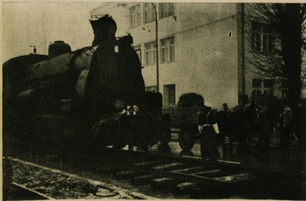
Ne prvi april — čista resnica — tračnice na Ljubljanski cesti

Konferenca je postavila trdne temelje in določila jasne koncepte za nadaljnje delo za čim hitrejši tempo modernizacije našega kmetijstva in s tem za boljše življenjske pogoje vseh ljudi v občini.