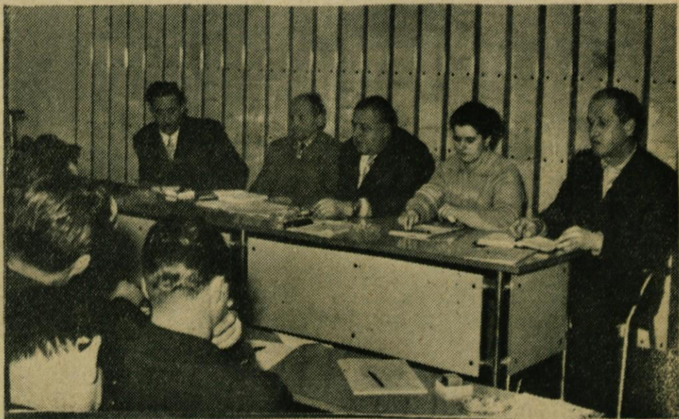
Delovno predsedstvo uspele občinske konference SZDL

V razpravi je bilo dosti govora tudi o socialnih problemih, ki nastajajo v kmetijstvu. Razprava je pokazala, da bi taki problemi nastajali, čeprav ne bi vršili socializacije kmetijstva. Vse take probleme je že doslej reševala družba, s povečanjem produktivnosti v kmetijstvu in intenzivno obdelavo vseh sposobnih kmetijskih površin pa bo te probleme še lažje reševati, ker bo materialna osnova družbe večja. Sprejet je bil predlog, da bi se ustanovil poseben sklad za kmetijstvo. Nadalje je bilo na konferenci govora o davčni politiki, ki zasluži revizijo v (Nadaljevanje na 2. strani)