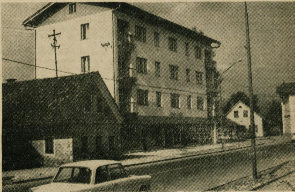
Staro in novo se srečujeta v Domžalah na vsakem koraku. Novi stanovanjsko poslovni blok z moderno specializirano trgovino električnega materiala se je umaknil razširjeni domžalski magistrali, hiše iz prejšnjega stoletja pa dokazujejo, da je v Domžalah še mnogo urbanističnih problemov

6. Občinski ljudski odbor je na tej seji sprejel tudi odlok o prenehanju veljavnosti odloka o uvedbi dopolnilne stopnje občinskega prometnega davka na žagani les iglavcev.