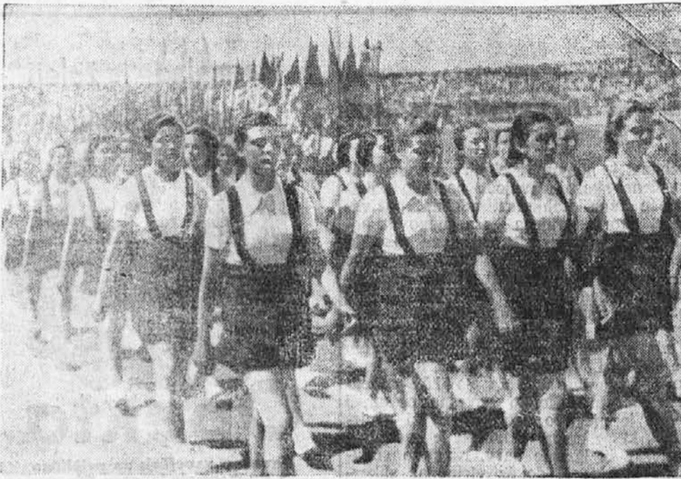
Nova in mlada Turčija. V Turčiji je bila do nedavnega žena zaslužena in manjvredna. Preteklo pa je tedaj dobrih deset let in že se je v Turčiji življenje iz temeljev spreminilo. Na podobi vidimo turška dekleta, ki organizirana korakajo v Sportni stadion v Ankari; to je sedanja mlada Turčija.