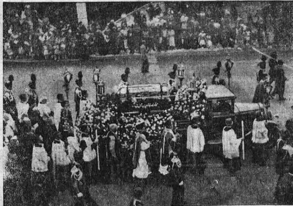
Svečani prenos zemeljskih ostankov poljskega svetnika Andreja Bobole, zaščitnika Poljske, na kolodvor v Rimu, odkoder so krsto prepeljali na Poljsko. Med potoma se je ustavila tudi v Ljubljani, o čemer smo poročali tudi v zadnji številki »Edinosti«.