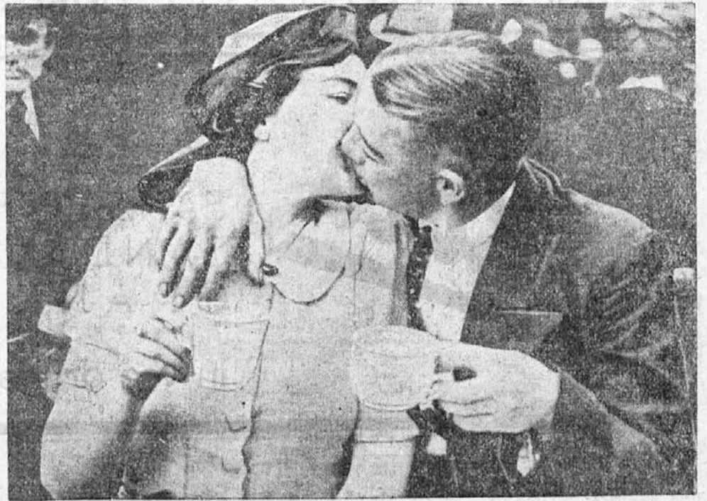
Z »ženitovanjskega trga«. V belgijskem mestecu Ecoussine priredijo vsako leto nekakšen »ženitovanjski trg«, na katerem pride tudi do prizorov, kakršnega vidimo na naši podobi in ki se mu pravi »ljubezen na prvi pogled«.

čez vezena z rubini, briljanti, smaragdi itd. Prednja kolesa gala-kočije bodo iz čistega zlata, dočim bodo zadnja »samo« težko pozlačena. Diadem, ki ga bo nosila princesa, bo reprezentiral vrednost 2 milijonov angleških funtov. Celo oblačila služinčadi bodo takrat tako obložena z dragulji, da bi pred njimi morala prebledeti od zavisti vsaka dolarska princesa. Krožniki, ovali, skleda itd. ne bodo samo iz čistega zlata, nego prav tako okrašeni z briljanti. Prekrasne mize z