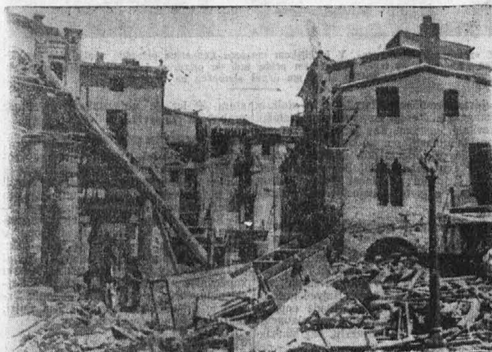
Iz Španije. Na podobi vidimo del španskega mesta Granollers po letalskem napadu nacionalističnih Frankovih letalcev.