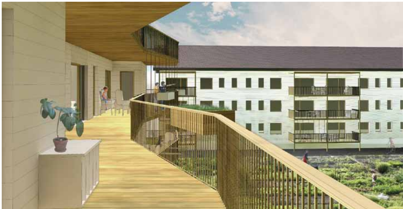
Slika 6: Arhitekturna in energetska prenova stanovanjskih objektov v Rudarjevem [Martin Sládek].