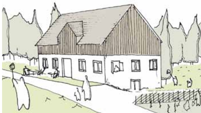
Slika 1: Skica ureditve kmetije Mežnar [Aleš Krdžić, Gašper Skalar].

Tu bi se radi zahvalili za izjemno priložnost, ki smo jo imeli v Črni na Koroškem in vas hkrati povabili k ogledu razstave. Zahvala pa gre seveda tudi vsem občankam in občanom, s katerimi smo imeli kontakt v času delavnice in so nam pomagali pri iskanju skritih potencialov občine Črna na Koroškem.