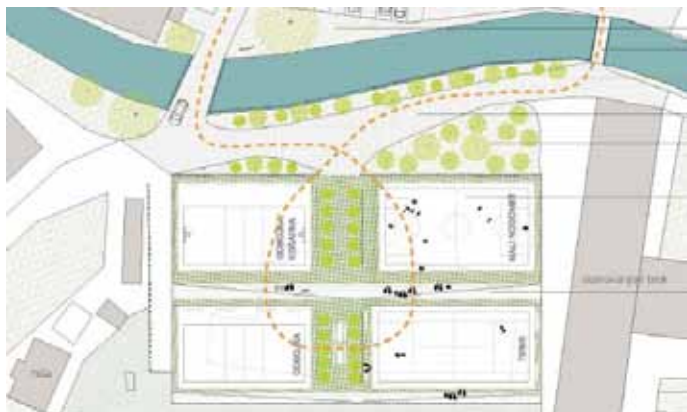
Slika 3: Ureditev novih športnih površin [Tina Javornik].