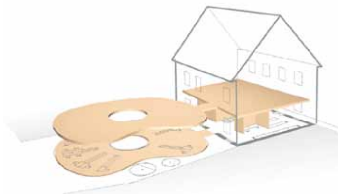
Slika 4: Koncept prenove knjižnice [Christian Stanonik].