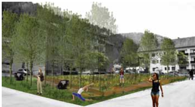
Slika 2: Ureditev stanovanjskih dvorišč v Rudarjevem [Jure Henigsman].