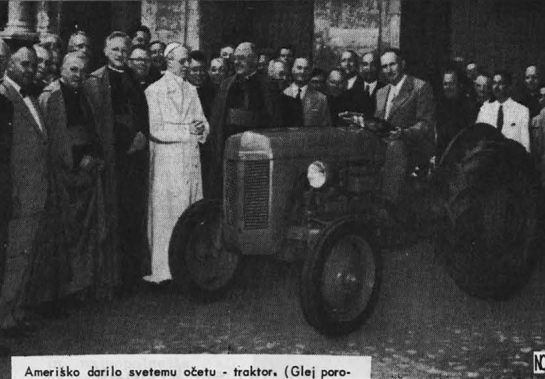
Ameriško darilo svetemu očetu - traktor. (Glej poročilo na strani 249)