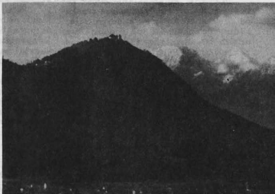
Šmarna gora s starodavno cerkvico Vnebovzete, priljubljena slovenska božja pot.

Vi, ki hodite na sveto Šmarno goro, blagor vam! hvalit Mater v nebo vzeto... France Prešeren