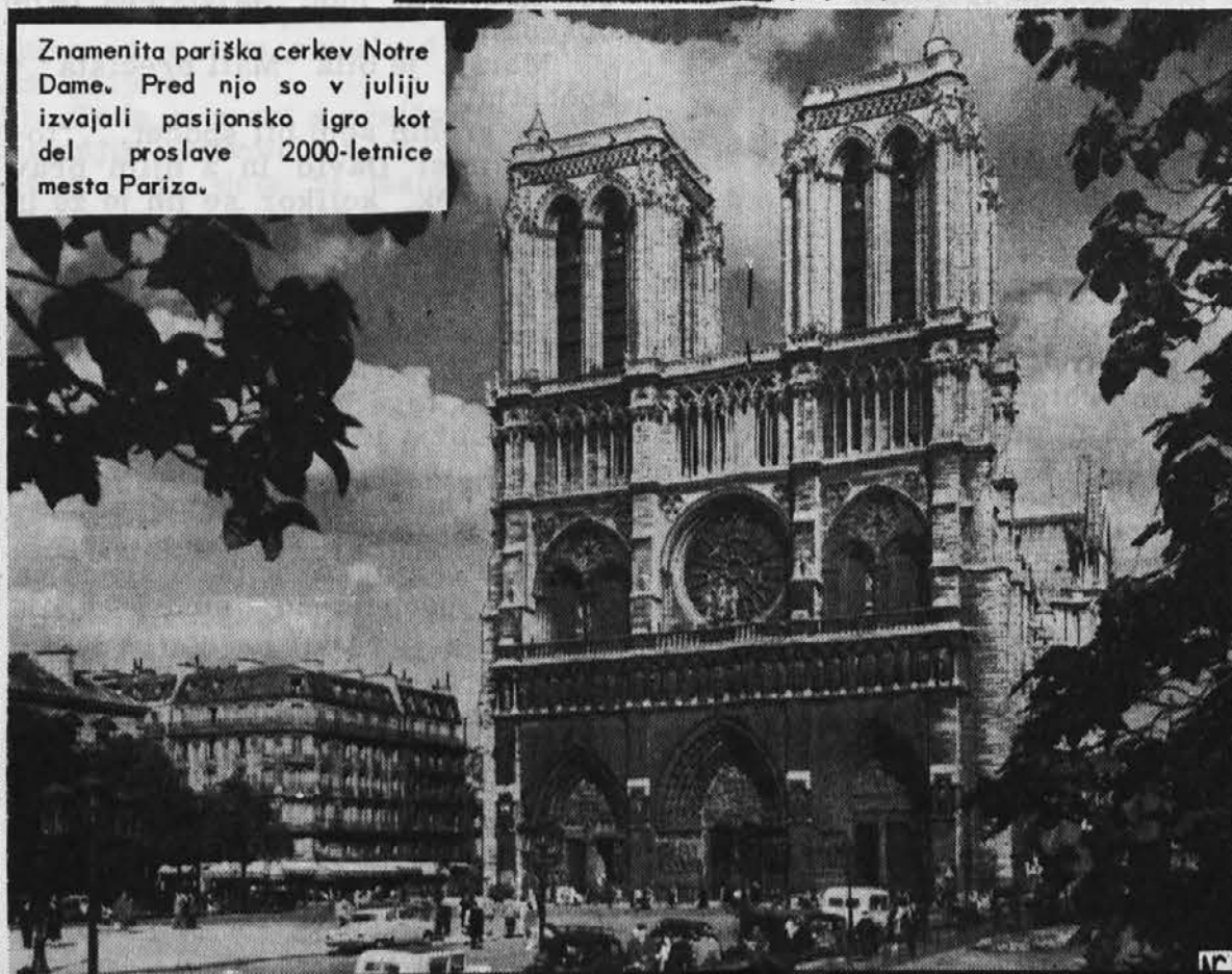
Znamenita pariška cerkev Notre Dame. Pred njo so v juliju izvajali pasijonsko igro kot del proslave 2000-letnice mesta Pariza.