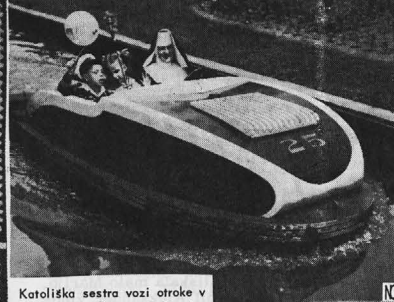
Katoliška sestra vozi otroke v motornem čolnu v Palisades Parku, N. J.