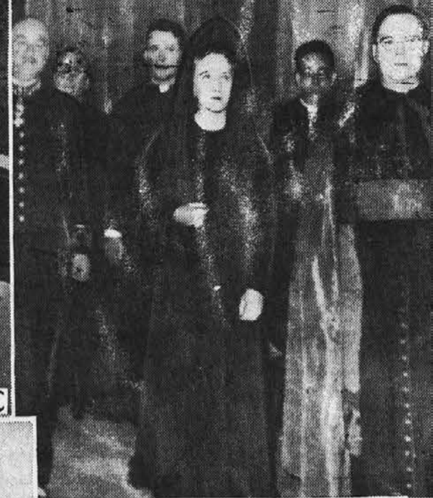
Margareta Truman, hči predsednika Trumana, je na svoji poti po Evropi obiskala tudi svetega očeta. Slikana je pred avdienco.