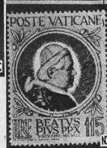
Vatikan je v spomin beatifikacije papeža Pija X. izdal posebne poštne znamke.