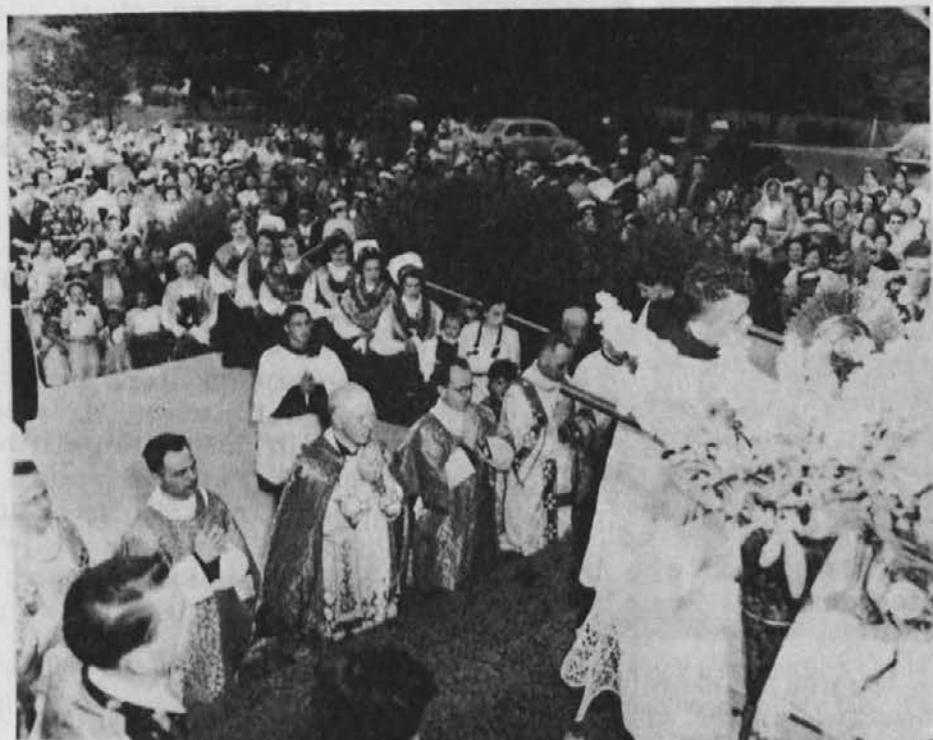
Iz jubilejne slovesnosti v Lemontu: Popoldanski blagoslov z Najsvetejšim pred samostanom

Vse sobotno popoldne so romarji oblegali spovednice in se tako pripravili za resnično