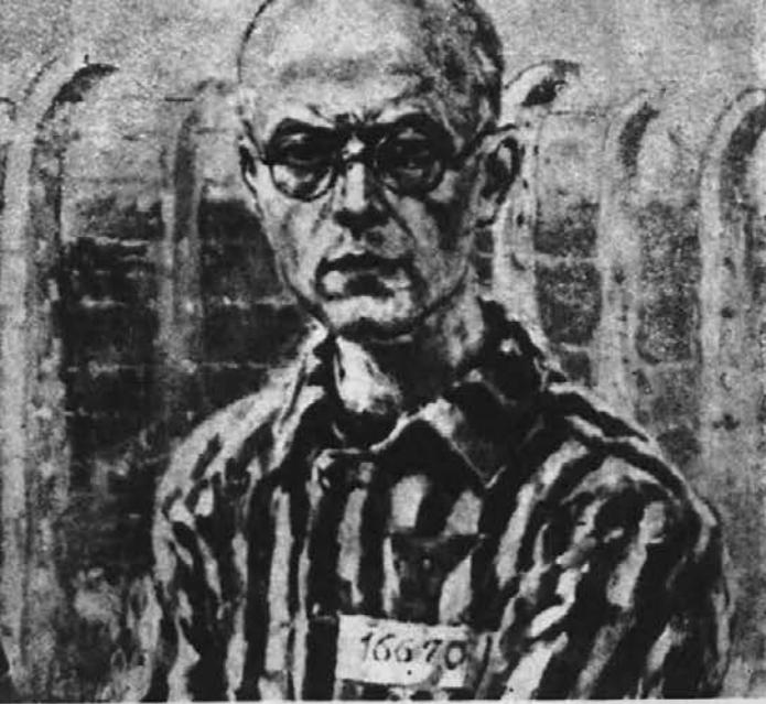
O. Maks Kolbe, ujetnik številka 16670, mučenec ljubezni do bližnjega

pravega sonca Kristusove vere - je ustanovil tiskarsko središče. Žal je ustanova v Nagasakiju po njegovem odhodu počasi zamrla.