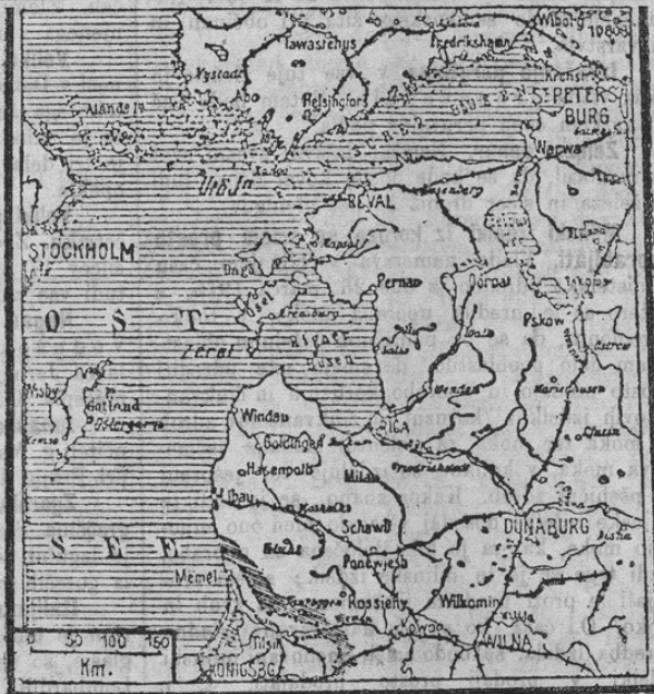
Zum Seegefecht in der Ost-See.

Prinesli smo v zadnji številki uradno poročilo o bitki v Vzhodnem morju. Nemške pomorske sile napadle so otok Utö. Prisilile so ruske parnike k nazadovanju in premagale sovražne obrežne baterije. Druge nemške križarke prepodile so ruske torpedne čolne v pristanišče Rige. Nemci niso imeli izgub. Ob tej priliki prinašamo v boljše umevanje uradnih poročil tozadevni zemljevid.