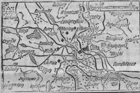
Die Festung Olita.

Pred kratkim so zavzele nemške čete malo rusko trdnjavo Olita, ki leži med velikimi