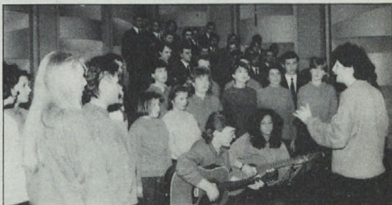
Ubrano je zapel tudi mladinski zbor iz Ledinc.