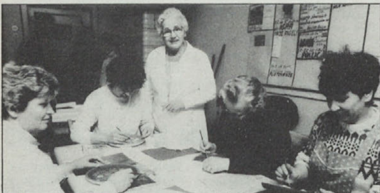
Kotmirške žene so se naučile umetnosti slikanja na les.

Kotmirško društvo „Gorjanci“ je v okviru letošnjega Rožanskega izobraževalnega tedna vabilo na dve prireditvi: