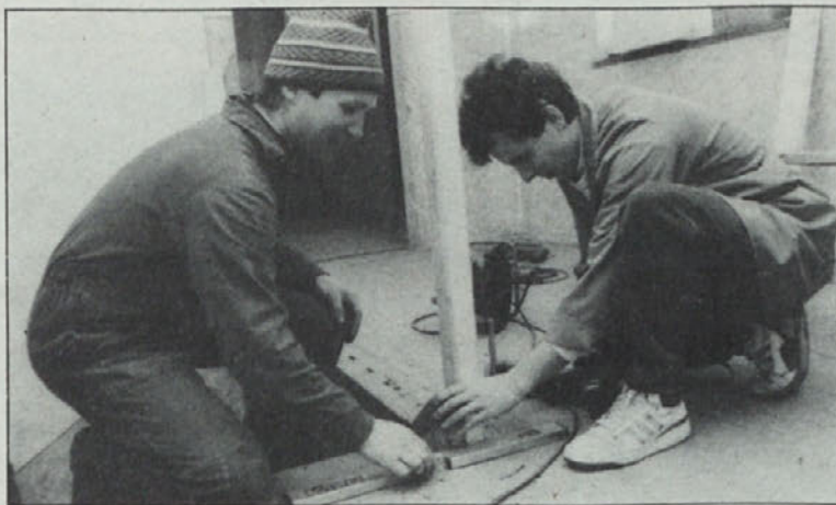
Mladi ljudje zdaj obnavljajo kulturni dom.

„KUMST — Kulturni most“ je v soboto vabil na delovno akcijo za obnovo kulturnega doma v Žitari vasi. Dom, ki je med vojno zgorel do tal in so ga po vojni na novo zgradili, je zadnja leta (če ne kar več) razpadal, ker smo se do njega obnašali mačehovsko. Pa so se našli mladi ljudje, ne glede na jezik ali narodno pripadnost in se odločili, da domu vdahnejo novo življenje pod geslom „Bodi most“. In v soboto, 10. 3. 1990, se jih je zbralo kar lepo število. Čaka jih — ali bolje rečeno: čaka nas še dosti dela. S skupnimi močmi in kopico dobre volje pa bo šlo.