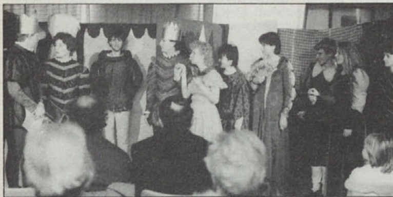
Domača igralska skupina je našturirala komedijo.