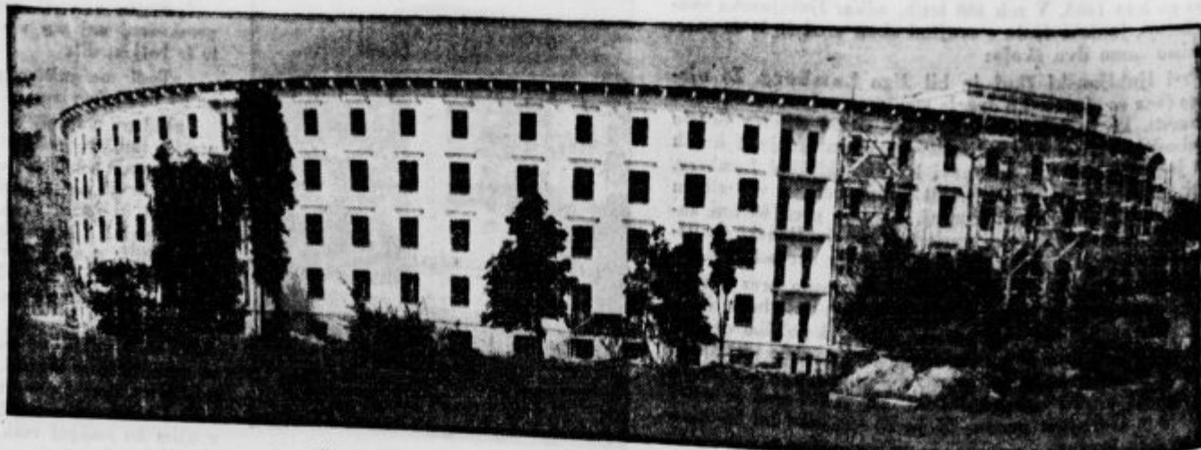
Glavno poslopje novega Baragovega semenišča v Ljubljani.