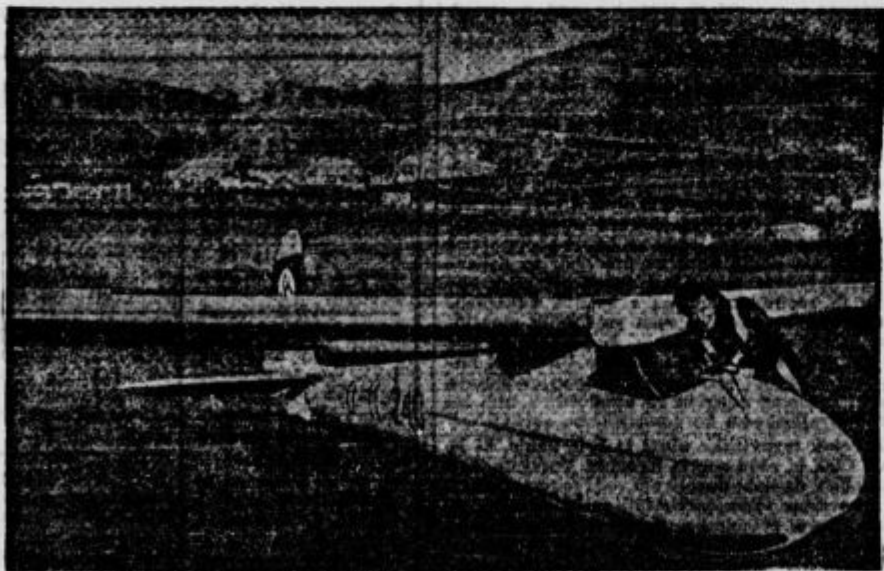
»Velezmotna jadrilica vrste »Meise«, namenjena za olimpijska tekmovanja.

mirno leti proti vetru k zemlji. Ko pristane na zemljo, gredo tovariši ponj. Eden skrbi za kolesa, katera podstavijo letalu, drugi pa za konja. Ko pridejo do letala, ga postavijo na kolesa, pilot privzdigne rep in za rep letala zaprežejo tudi konja in ta potegne letalo na grič. Ko pridejo do učitelja, odprežejo konja, raztovorijo letalo, in vzlet se vrsti za vzletom, dokler ne pridejo vsi na vrsto in dokler piha veter. Opoldne gredo kosit, le eden ali dva varujejo letalo pred vetrom, popoldne pa nadaljujejo. Proti večeru pa prepuste letalo začetnikom, in ti pod hribom, skoraj na ravnem terenu nadaljujejo svoje jutranje šolanje do teme. Ako piha