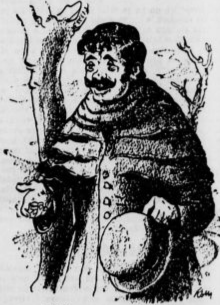
»Pojdite no, gospod, pojdite!«

Ustavil sem si bil ideal, ki je bil drag mojemu arcu, in ga deloma tudi dosegel. Z Rowleyjem ava bila gosposko oblečena, vesela svetlooka mladeniča in vselej, kadar ava stopila iz svoje rdeče kočije, ava se vedla kot dva ugledna človeka. Brigala ava se kot dva plemiča samo za svoje zadeve, občevala samo s seboj, in sicer s tako dostojnostjo in vljudnostjo, kot bi bila že od mladega vajenal