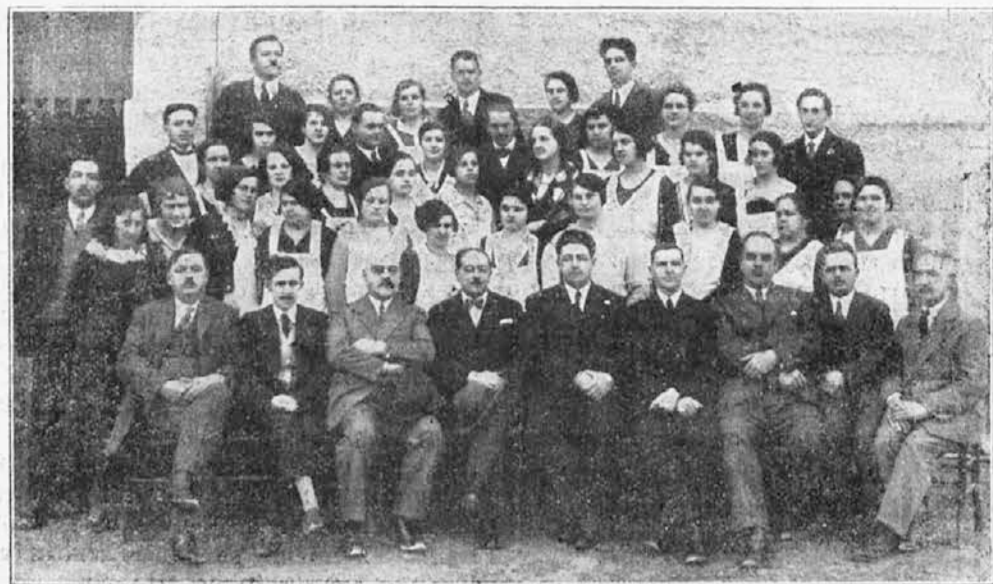
I. servirni tečaj združenja gostln. podjetij na Vrhniko

Če vrši izvoz v inozemstvo neposredno proizvoznik, ki ni točilec pijače na drobno ali na debelo, ni treba postopati po predhodnem členu.