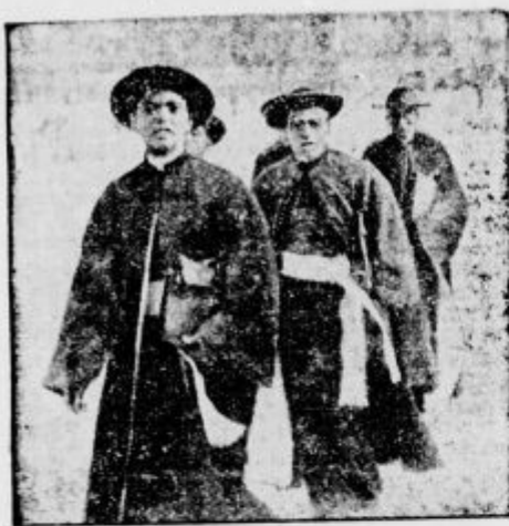
Abesinski semenišniki v Rimu