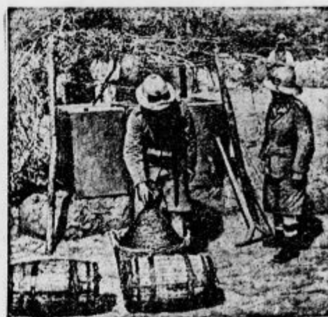
Ob abesinskem studencu.