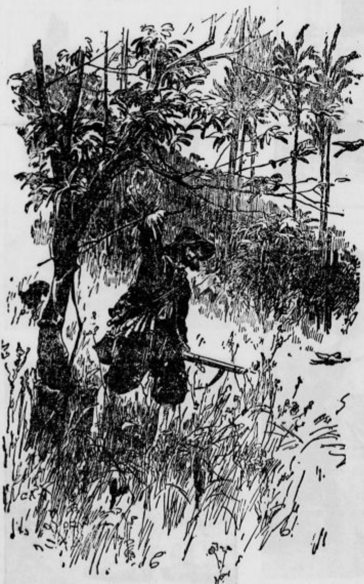
S palico sem zadel papigo, da je omamljena padla na tla