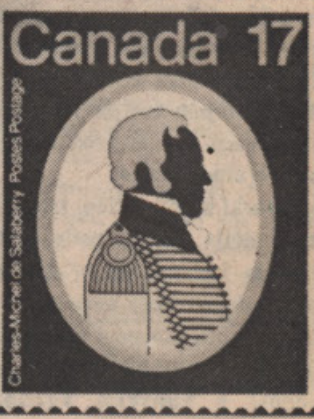
Charles-McCormac de Salaberry, Postal Postage