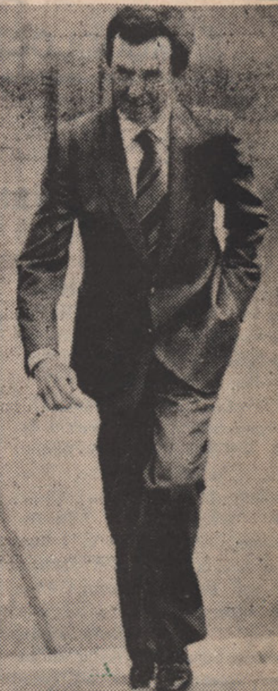
Rt. Hon. Joe CLARK, novizoizvoljeni kanadski ministerijski predsednik