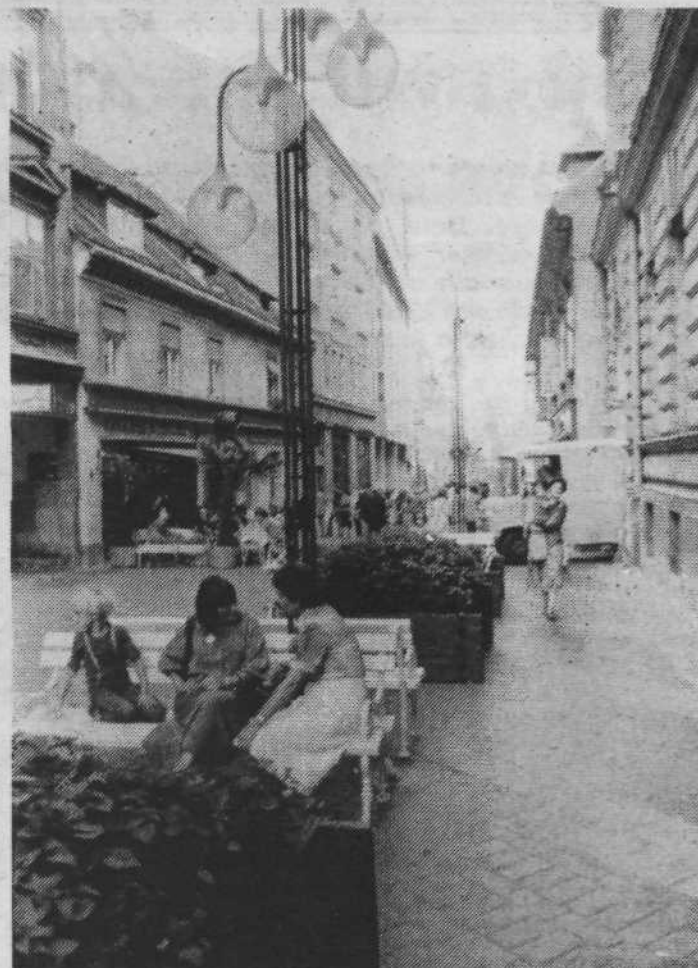
Na Čopovi ulici - prijetni oazi za pešce v središču mesta - bo potrebno še marsikaj urediti.

Sprejet je bil dogovor o pristopu k evidentiranju stanovalcev. Aktivistom, ki bodo skrbeli za popis, so bili razdeljeni popisni listi, na katerih se lahko krajani opredelijo za področja, na katerih želijo v naslednjem mandatsnem obdobju delovati. Na vseh treh sestankih je poveljnik štaba civilne zaščite prisotne seznanil z organiziranjem civilne zaščite na terenu in opozoril na pomanjkljivosti v posameznih stanovanjskih hišah, ki jih bo potrebno v nakrajšem času odpraviti.