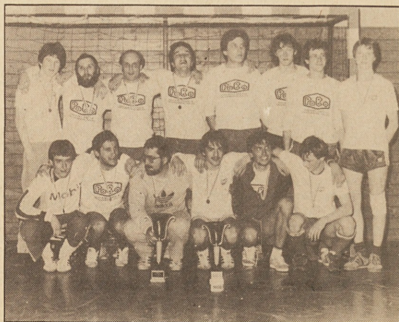
Finalista Santos 7.a in Naš tednik

3. in zadnji turnir za pokal KDZ bo predvidoma meseca februarja v nogometni dvorani v Borovljah.