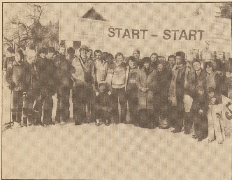
Organizatorji so pripravili za tekače odlično tekaško stezo in so bili s potekom in z udeležbo zelo zadovoljni.

Kot že lansko leto sta tudi letos prevzela pokroviteljstvo tovarna smučil ELAN na Brnci ter NAŠ TEDNIK.