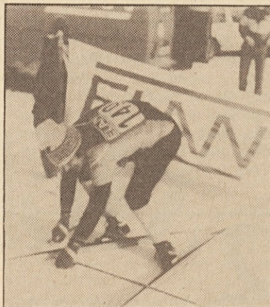
Hopla, Franciju je spodrsnilo...