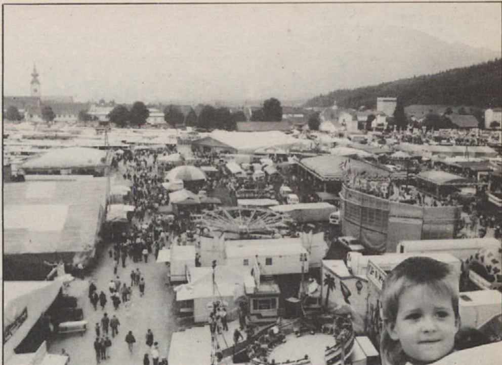
50.000 obiskovalcev so letos našli na jormaku. Ga bodo že kmalu priredili ves teden?

Ponudba razstavljalcev na letošnjem jormaku je prav tako narasla, pa tudi število razstavljalcev iz leta v leto raste. Tako v Pliberku že razmišljajo, da bi v prihodnje razširili pliberški jormak na ves teden, kar bi pogojilo gotovo še dodaten dotok razstavljalcev in seveda tudi obiskovalcev.