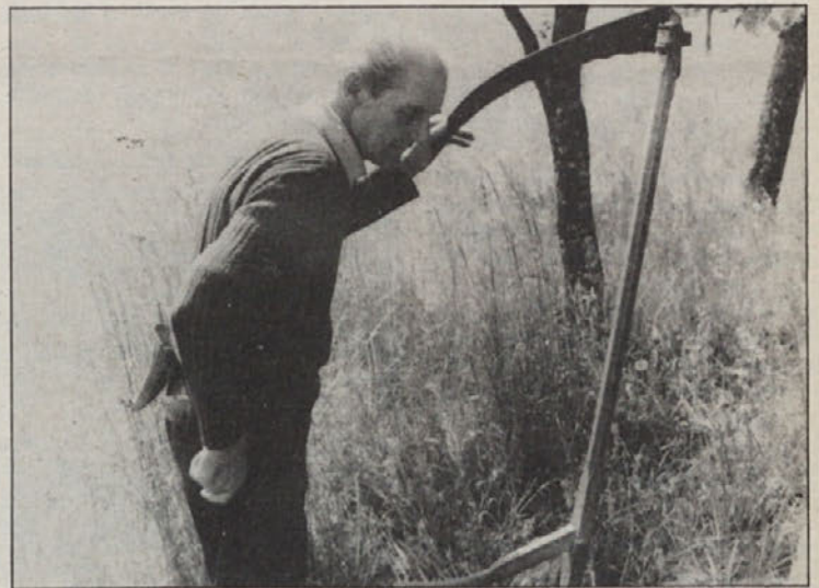
Nizke pokojnine delajo marsikateremu kmetu preglavice. Nasplošno pa bo potrebna reforma socialne zavarovalnice za kmete na marsikaterem področju, da kmetje ne bodo ostali drugo- ali tretjerazredni poklicni stan.

pri pokojninski zavarovalnici do nekaterih sprememb, ki so deloma pozitivne, deloma pa prinašajo za zavarovane neugodnosti. Zaradi tega vas hočemo informirati o teh spremembah, tako da se boste lahko poslužili možnosti, katere imate kot zavarovani pri kmetijski zavarovalnici.