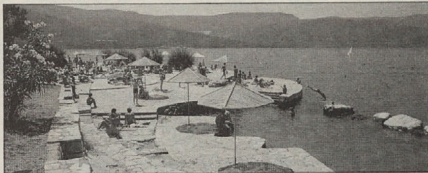
Otok Hvar ima največ ur sonca v Jugoslaviji

NAŠ TEDNIK, Viktringer Ring 26, 9020 Celovec.