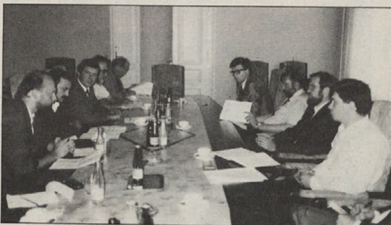
Koordinacijski odbor koroških Slovencev je informiral slovensko vlado o zahtevah koroških Slovencev. Slovenska vlada je v celoti upoštevala mnenje za stopstva slovenske narodne skupnosti.

Vsa prizadevanja za rešitev vprašanja dvojezične ljudske šole v Celovcu med mestom, deželo in Mohorjevo so doslej bila neuspešna. Mohorjeva je pod določenimi pogoji pripravljena sprejeti vse šolarje in bi s tem omogočila, da bi doslej privatna šola postala javna. Toda Haider natenkrat zahteva, da mora biti v Mohorjevi šoli možen tudi pouk izključno v nemškem jeziku, kar pa je seveda za