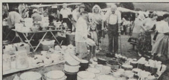
Po ugodni ceni nov lonec za kuhinjo . . .