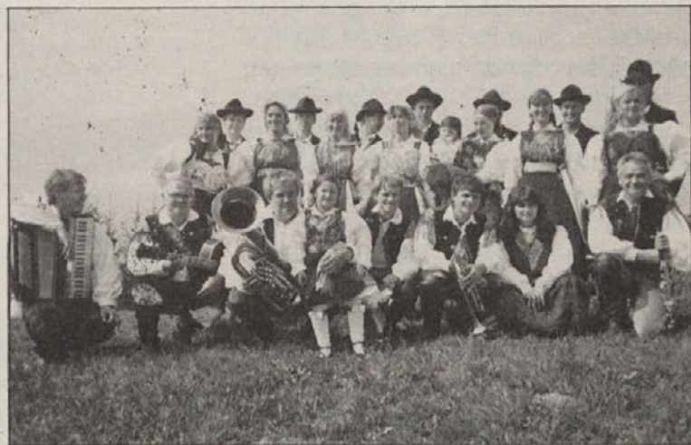
Ansambel Vita Muzeniča in zahomska konta

Fantje in dekleta iz Zahomca vabijo na ziljsko štehanje in rej pod lipo, ki bo v nedeljo, 9. septembra 1990, ob 14. uri. Za ples bo igral ansambel Vita Muzeniča.