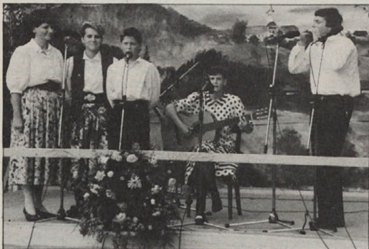
Družina Lipusch redno sodeluje pri „Družina poje“.