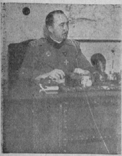
General Dušan Simović

vse, kar so imeli: pu titi so morali svojo stanovanja z vsem pohištvo, perilom, knjigami in drugim ter se poslušati sadistične pripombe Nemcev: "Tu se bo sedaj nastanil nemški učitelj!", "To bodo rabili nemški otroci, ki bodo semkaj prišli", "To bo nemški ženski prav dobro prišlo", itd.