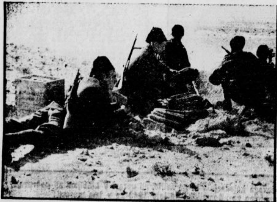
Mladi fašisti ob protitankovskem topu na afriškem bojišču.

3.770.000 ton je dal celotni pridelok na Dan-skem.