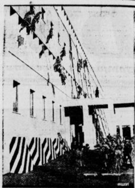
Duce prisostvuje v Rimu vaji gasilskih čet.

Poslušanje radijskih prenosov — razen Osnih — so te dni prepovedali na Slovaškem.