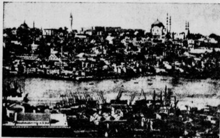
Pogled z galatskega stolpa na Zlati rog