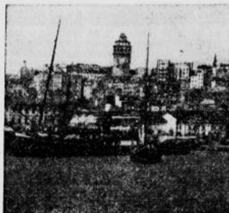
Galatski stolp nad pristaniščem

«Slovenčev koledar» v vsako hišo! Ima pestro vsebino in veliko slik! Stane samo 20 lir.