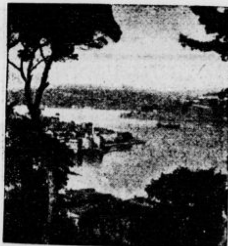
Pogled na Bospor