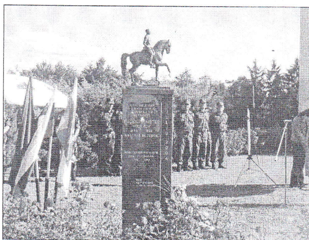
Slika 2: Odkritje spomenika generalu Rudolfu Maistru pri Svetem Tomažu.

Datum odkritja spomenika pri Sv. Tomažu smo določili za 3. julij 2004. Ta dan je sovpadal s praznikom KS, obenem pa je bilo razvitje veteranskega prapora in odkritje spominske plošče veteranom vojne za Slovenijo. Osnovna šola je na