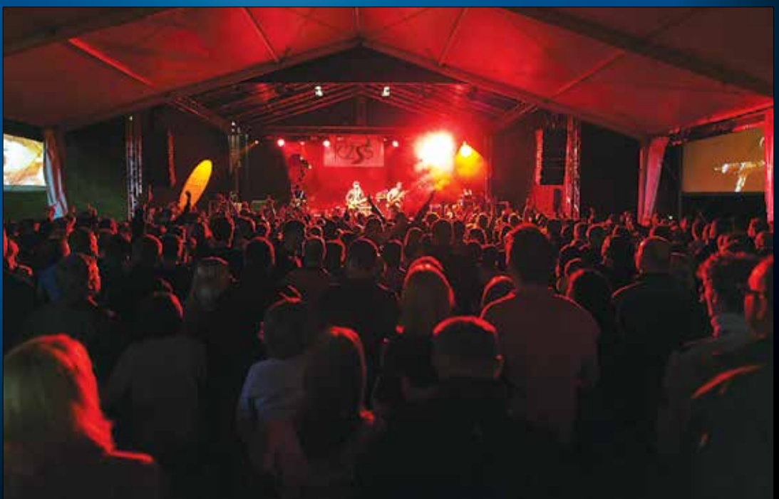
Publika na Ljubnem ob Savinji je ponovno dokazala, da se v Zgornji Savinjski dolini res dobro »žura«.

restavracija - sobe (Arja vas - Velenje) tel.: 03 714 80 60 Marjola - malice (Zalec - center) tel.: 03 710 37 30