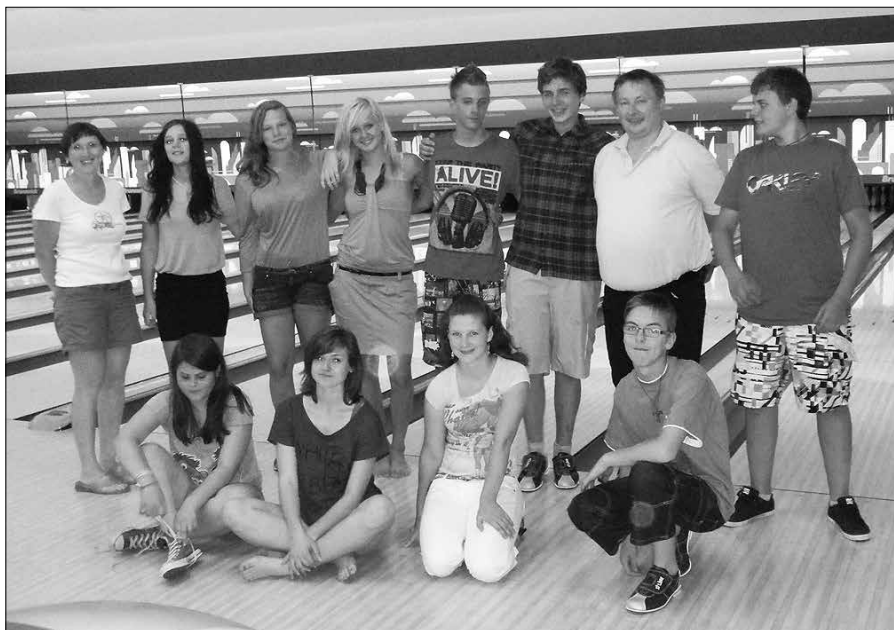
Devetošolci iz Luč z županom na bowlingu v Celju

Po izletu je Rosc povedal: »Mladi so na izletu uživali. Bowling jim je pomenil druženje, rekrea-