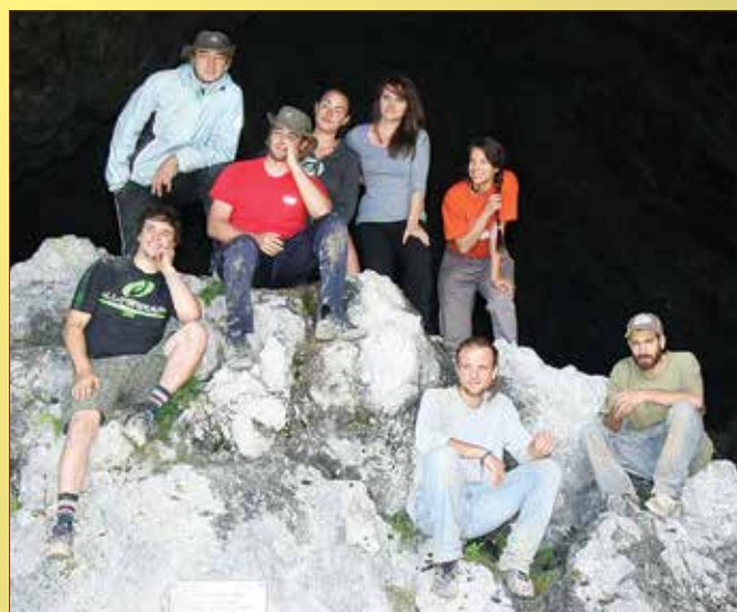
Skupina mladih arheologov na skali pred Potočko zijalko - zatočiščem ledenodobnega človeka na Olševi

Rinka v Solčavi izvedel tudi predavanje »Potočka zijalka - svetišče paleolitskih lovcev«, ki je pritegnilo pozornost širše strokovne javnosti. Predstavil je svoje poglede in dejstva o odkritjih v tej jami. Svoje poslanstvo je ob teh dogodkih opravila tudi stalna razstava o Potočki zijalki in muze-