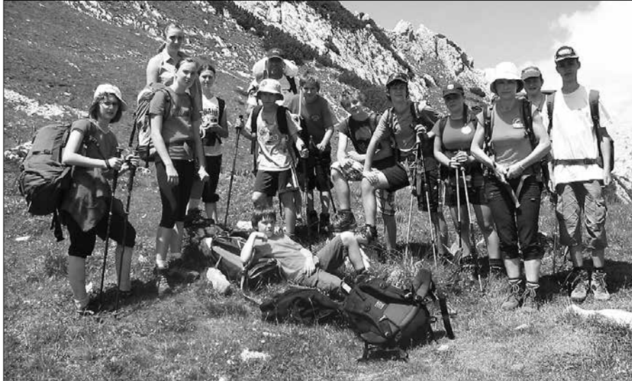
Mladi nazarski planinci so se iz Julijskih Alp vrnili polni lepih vtisov.