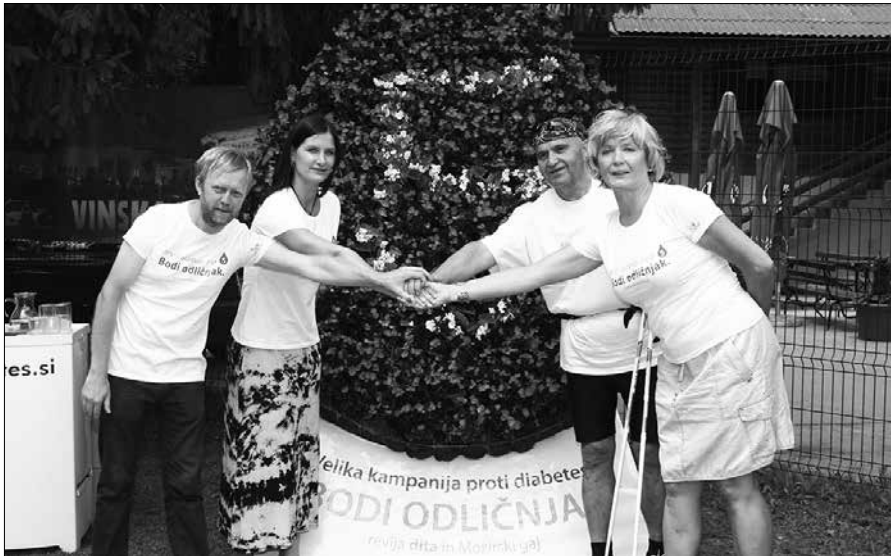
Podporniki vseslovenske kampanje za spreminjanje diabetesa pred gredico z znakom akcije v Mozirskem gaju