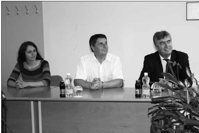
Evropski poslanec in predsedniški kandidat dr. Milan Zver (desno) je z zanimanjem prisluhnil županovi predstavitvi mozirske občine.