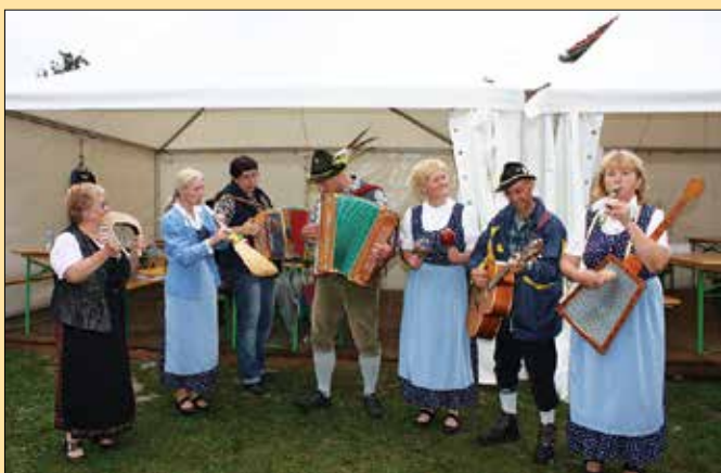
Ljudske pevke Pušeljc so skupaj z muzikanti razvedrile maloštevilne obiskovalce.

Tako so v dopoldanskem času na svoj račun prišli športniki, ki so merili moči v malem nogometu. V močni konkurenci so nogometaši ŠD Gornji Grad izkoristili prednost domačega igrišča in osvojili vse lovoričke, kar pomeni pokal za prvo mesto in prehodni pokal, v svojih vrstah pa so imeli tudi najboljšega strelca in najboljšega vratarja turnirja.