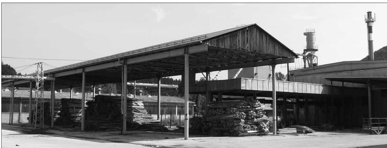
Žagalnica je skupaj s podjetjem GG Nazarje doživela klavrn konec.

Soklič je prepričan, da Grobelnik in Prebil nista ravnala kot dobra gospodarja. Grobelniku očita, da je prepozno predlagal stečaj, da ni obveščal upnikov, da ni unovčeval premoženja, da je s podpisom sporne pogodbe prekoračil svoja pooblastila in da ni vložil pritožbe zoper sklep upravne enote o ustavitvi denacionalizacijske-