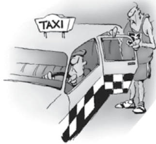
Peljite me s tekaško hitrostjo.

„Brez skrbi. Ti boš ravno kaki dvajseti.“