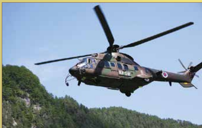
Transport treh ton izkopane materiala je opravila posadka helikopterja Slovenske vojske.

V akciji posadke helikopterja 3. oddelka 15. helikopterske brigade KFOR (SV) in gorskih reševalcev so material prepeljali najprej v Logarsko Dolino, nato pa v Solčavo, kjer je naslednjih pet dni potekalo izpiranje in iskanje morebitnih paleolitskih ostankov oziroma predmetov. Raziskava do zaključka redakcije še ni bila končana.