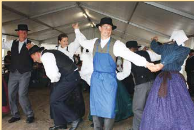
V kulturnem delu programa so sodelovali tudi folkloristi.

Kulturni del programa so začeli zgornjesavinjski godbeniki, nato pa so na sceno stopile ljudske pevke Pušeljc, ki so v sodelovanju z muzirsko izpostavo Javnega sklada za kulturne dejavnosti Republike Slovenije pripravile srečanje pevcev, godcev in muzikantov ljudskih viž in napevov. Pod naslovom Pod to goro zeleno se je predstavilo enajst skupin iz vse Slovenije ter gostje iz Italije in Hrvaške.