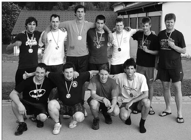
Najboljše tri ekipe z občinskega prvenstva trojk v košarki.