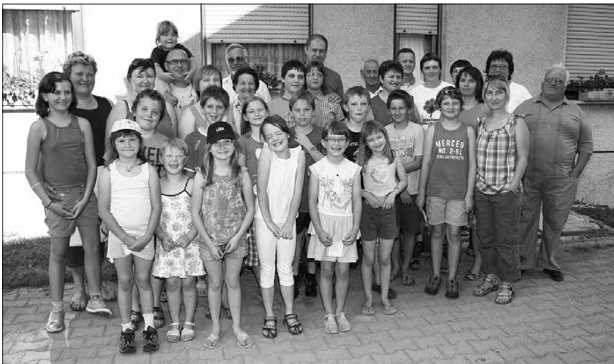
V Lačji vasi se je na zaključku zbrala vesela čebelarska družina.