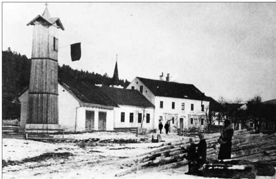
Povečan gasilski dom v Šmartnem od Dreti. Slika je bila posneta pred letom 1937 in jo hrani Muzejska zbirka v Gornjem Gradu.