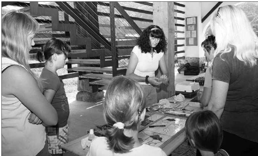
Izdelovanje nakita iz stekla je pritegnilo precejšnjo pozornost obiskovalcev.