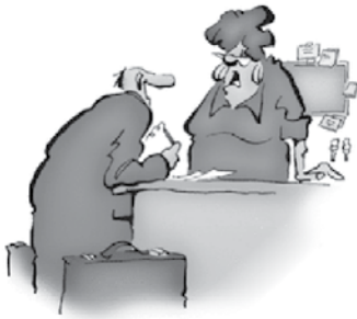
Zamudili ste zajtrk. Bil je ob 5h zjutraj!