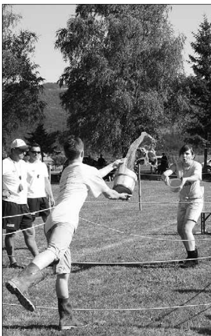
Štafetno zbiranje vode

Z igrami med naselji v občini Rečica ob Savinji so drugo nedeljo v juliju člani turističnega društva zaključili niz prireditev, ki so jih pripravili v sklopu 33. Od lipe do prangerja, s tem pa se je tudi uradno zaključil mesec praznovanj ob občinskem prazniku rečiške občine.