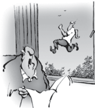
O, ne! Kupil si je trampolin!

„Seveda, saj Francozi menda ja ne bodo zamerili, če bom odhajal po francosko, ko bo treba plačati.“