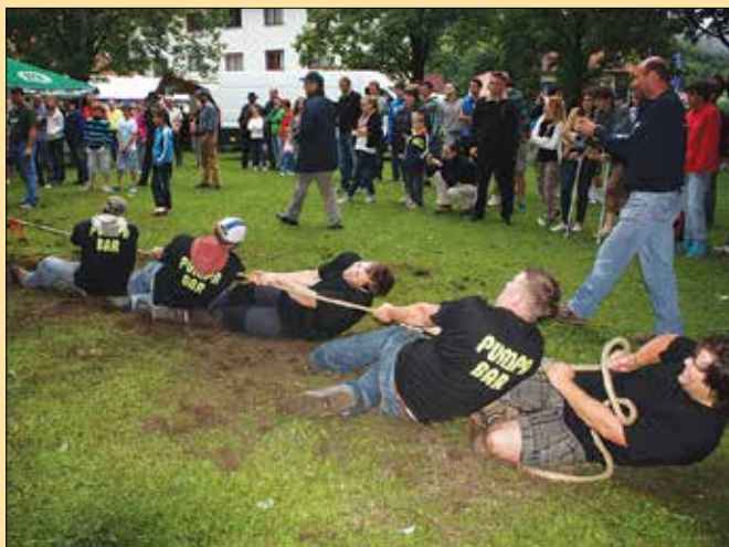
V vlečenju vrvi za pokal strdi je bila nepremagljiva ekipa Bar Pumpa.

V vlečenju vrvi za pokal strdi se pomerile štiri ekipe, in sicer Bar Pumpa, Davidov hram, PGD Gornji Grad in Gozdarji. Obuti v delovno obutev so si s posebno tehniko »vkopava-