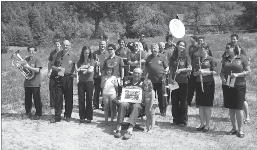
Godbeniki so slavlencu v spomin izročili fotografijo godbe, v kateri je igral v času svoje mladosti.

Po vojni si je z Marijo Urtejl ustvaril družino. Na Puški domačiji v Zavodicah sta zrasla hčerka Marica in sin Rudi. Čas sta mu zapolnjevala kmetovanje in delo v bližnji tovarni, otroka pa sta zrasla in se poročila. Sin je prevzel skrb za domačijo, hčerka si je ustvarila dom v Lokah pri Mozirju.