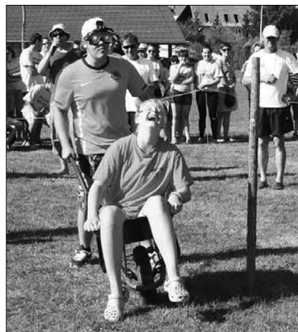
Voznik samokolnice je z zavezanimi očmi vozil po navodilih sotekmovalke.