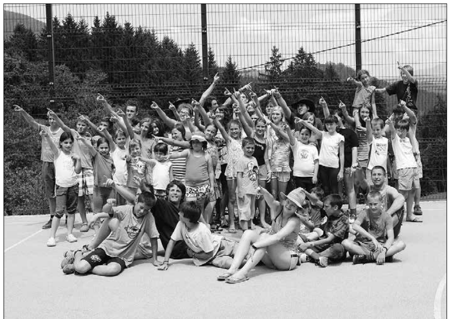
Prijateljsko druženje na oratoriju je nepozabno za vse udeležence.