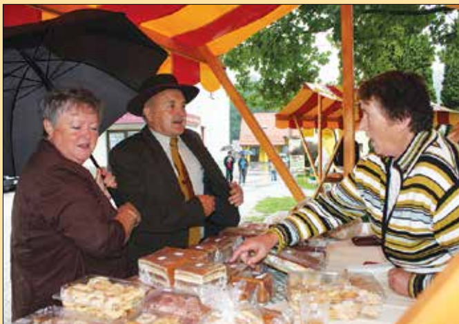
Ponudba na stojnicah je bila zaradi slabega vremena okrnjena.

Turistično in Čebelarstvo društvo Gornji Grad sta v sodelovanju z občino pripravila 25. Čebelarški praznik. Zaradi deževnega vremena je bil prvotni koncept prireditve sicer bistveno okrnjen, vendar se vztrajni organizatorji niso pustili zmeti in so izpeljali vse tiste aktivnosti, ki so jih dopuščale okoliščine.