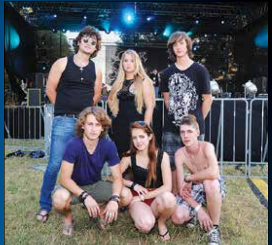
Up N'Downs na Otočcu