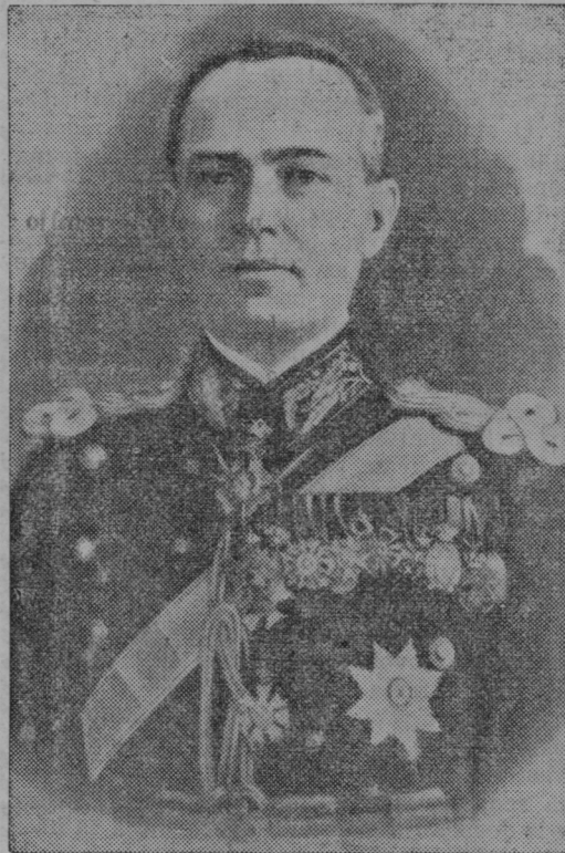
General Antonescu, diktator Romunije

Glavno mesto Bukovine so Černovice s 130 tisoči prebivalcev. Pod staro Avstrijo so nazivali bukovinsko prestolnico »mali Dunaj«, ki pa je danes povsem predrugačen. Po černoviških ulicah že po šestih tednih ruske zasedbe lahko vsakdo opazi, da sta popolnoma propadla obleka in obutev. Ljudje, ki so prišli z rdečo vojsko iz notranjosti Rusije, so nezadostno oblečeni, hodijo okrog v raztrganih oblekah, so obuti v ničvredna obuvala in je videti, da so že davno izgubili vsak smisel za dostojno in poštenega človeka vredno obleko. Ruske ženske, katere so se naselile po zapuščenih stanovanjih, so takoj oblekle tamkaj puščena oblačila, a so jih morali poprej poučiti, kako se jih je treba posluževati. Rusko