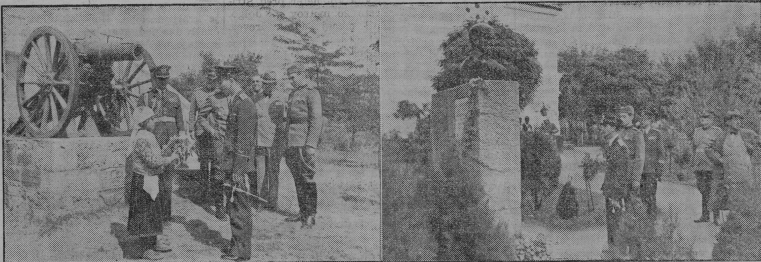
Kralj Peter II. je v začetku minulega tedna obiskal znano srbsko mesto Niš. V Čegru pri Nišu, kjer je bila bitka s Turki, stoji spomenik srbskega junaka Singjeliča. V tem kraju je izročilo kmečko dekletce kralju šopek poljskega cvetja. Na sliki levo vidimo izročitev šopka, desno si ogleduje kralj spomenik omenjenega junaka. V ozadju stoji ministrski predsednik Dragiša Cvetković, ki je doma iz Niša