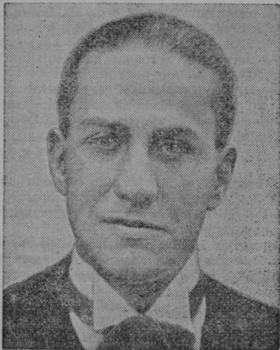
Italijanski zunanji minister grof Ciano

Nevedne poučevati je dobro delo, ki ima pred Bogom še višjo ceno, če se ta pouk nanaša na dušo. Boga in večnost. Ta naloga pri-