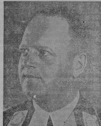
Nemški zunanji minister von Ribbentrop

Pismo je dobila skoraj teden dni pozneje, ker je ležalo štiri dni v Kapli in dva dni v Podklancu. Treziko je namreč doktor Šilan spravil za Malo Gospojnico k sebi v Vrbo, naj bi si ogledala svoj bodoči dom. Dne 7. septembra se je odpeljala in dne 10. septembra se je vrnila v Kaplo. Tu je našla Končnikovo pismo in ga je v novem ovitku takoj poslala. Tilki v Podklanec. Podklanški pismonoša pa je šele drugi dan šel po kmetih pošto raznašat in tako je prejela Tilka pismo šele dne 12. septembra. Vsa razburjena je šla na samo in ga je hlastno prebrala, potem pa se je bridko razjokala. Niti besedica ni stala v pismu, ki bi pričala, da je sodišče njeno poroštvo sprejelo; torej tudi ni bilo upanja, da bi Jurij ušel poroti. Prebrala je pismo še drugič in tretjič in vedno bolj so jo silile solze. Ljubezen, usmiljenje in sočutje z nesrečnim možem jo je čisto prevzelo. Ko bi mu le mogla pomagati! Nikakor ne sme več čakati. Vsaj pisati mu mora, da ga potolaži. Ko je šla papir iskat, ji je prišlo na misel, da bo preveč časa minulo, preden pride pošta zopet skrižem. Ne, rajši pojde kar jutri zjutraj v Celovec pa se bo z Jurijem lepo pogovorila. Morda se ji tudi posreči, da najde dobrega advokata, ki bi ji moža rešil in oprostil. —