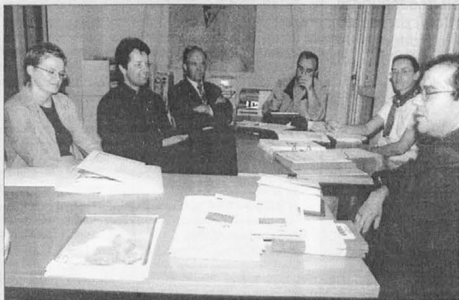
Una delegazione di operatori turistici sloveni della Carinzia ha fatto visita martedì 11 alla sede dell'Ures di Cividale, dove si è incontrata e confrontata con rappresentanti dell'Unione regionale economica slovena e dell'associazione Invito

rici e artistici, nel suo intervento conclusivo ha voluto ricordare la notevole attenzione che la figura di Diacono ha ricevuto da numerosi enti ed istituzioni.