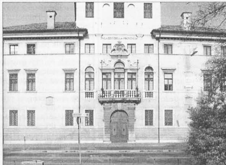
Sedež videmske Pokrajine

Gre tudi dodati, da se po mnogih ocenah tokrat zadnjič voli za Pokrajino, tako kot smo jo doslej poznali, kajti ta institucija naj bi v kratkem doživela spremembe. Sicer pa, o spremembah se govori že dolgo, govori se o novih kompetencah, ki naj bi jih pridobila pokrajinska uprava,