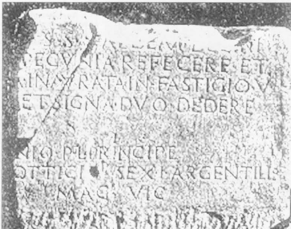
Lapide che ricorda la ricostruzione di un tempio dedicato al dio Beleno a Zuglio Carnico nel I secolo a.C.

Una delle prove più interessanti della celticità del Friuli è l'aspetto religioso e principalmente il culto radicato e quasi specifico del territorio del dio Beleno. Tagliaferri ritiene «prove sicure della presenza "attiva" celtica ... i piccoli bronzi in forma di idoletti apparsi qua e là in Friuli». Lo studioso olandese Jan De Vries, nel volume "I Celti", precisamente nel capitolo in cui tratta delle trasposizioni di Apollo tra le divinità celtiche - ogni provincia romana aveva il proprio dio - osserva che Belenus fu venerato in una zona ristretta presso i Norici e soprattutto ad Aquileia dove il dio Beleno godeva grande stima e veniva fatto passare per Apollo. Questo culto così importante presso i paesi delle Alpi orientali è documentato da iscrizioni su lapidi e monumenti, anche in associazione esplicita di Beleno con Apollo, come appariva nell'epigrafe - purtroppo spezzata per metà - che gli imperatori romani Diocleziano e Massimiano dedicarono al dio. Altre iscrizioni tuttavia sono state trovate sparse anche in altre località dell'Italia settentrionale e della Gallia meridionale.