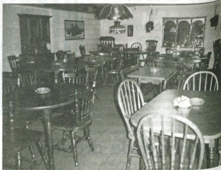
KLI-jevski stoli na sejmu pohištva v High Pointu