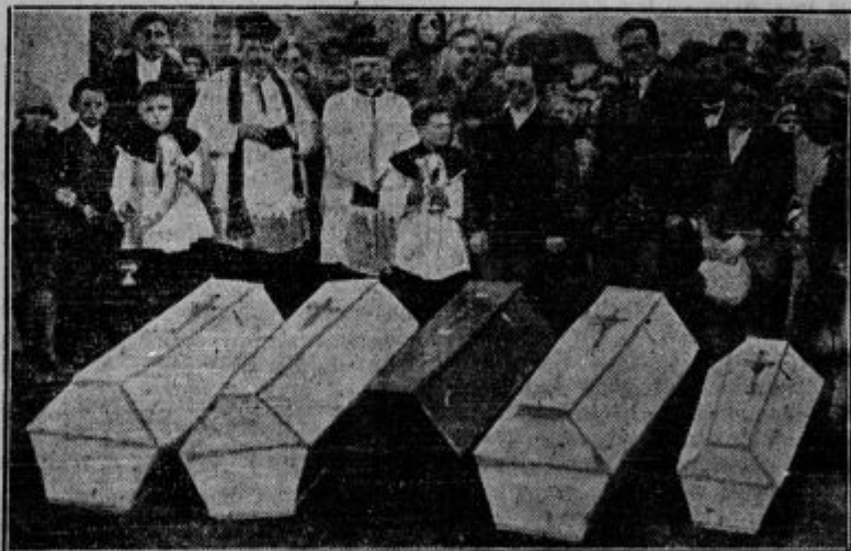
Vse žrtve Dobajeve družine, ki so jih pokopali v skupen grob.

S Hriberskim sva prišla po 10 ponoči na Veliko soboto k Dobajevim. Bila sva zelo utrujena, žejna in lačna. Šla sva v klet in si tam privoščila malo pijače. Nato sva šla v Dobajevo spalnico. Ni- sva imela namena nikogar umoriti, šlo nama je samo za denar. Za vsak slučaj pa sva vzela s seboj