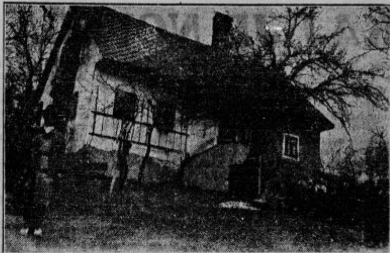
Dobajeva hiša; zadaj hlev.