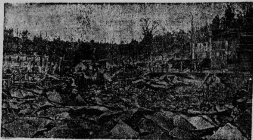
Celo mesto uničil požar. Razvaline mesta Bagnell v severoameriški državi Missouri, katero je požar popolnoma uničil.