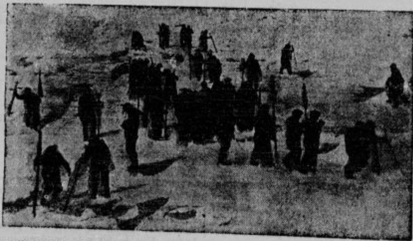
Slika priča o strahoti: Tekmovanje posadke ponesrečene ladje »Viking« s smrtjo. Blizu obale Nove Fundlandije je bil po eksploziji porušeni parnik »Viking«, ki je vozil filmsko ekspedicijo neke ameriške tvrdke. Okrog 60 ljudi, ki so se rešili na plavajoči led in ki ga je morje odnašalo vedno bolj daleč od obale, je po večurnem boju z ledom, viharjem, skakajoč z ene ledene plošče na drugo, doseglo obalo.

»O, pač,« je priznal mladi snubač, »coln sem nalašč prekucnil.«