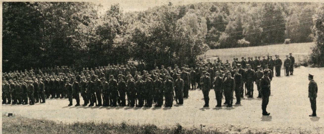
Predaja raporta pred odhodom enote na vajo.

vam želijo SREČNO NOVO LETO 1979 in čestitajo k PRAZNIKU OBČINE LITIJA