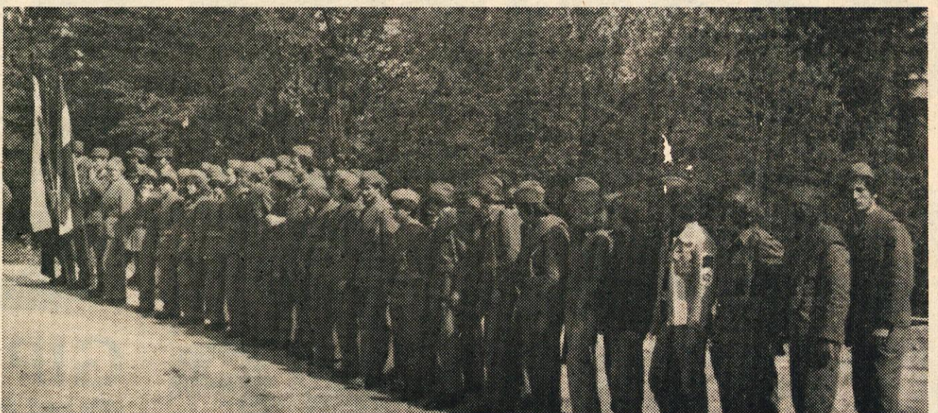
Sprejem mladih prostovoljcev v teritorialno enoto

Vsako leto se dvakrat zberejo v vasi Tisje mladinci — prostovoljci, ki bodo sprejeti v vrste teritorialne obrambe. Pred spomenikom se postavijo v vrsto. Sledi kratek kulturni program, nato pa jim eden od preživelih borcev z bitke na Tisju pripoveduje o življenju, delu, odrekanju in trdnih odločitvah zmagati nad fašizmom in okupatorjem, zlasti tistih, ki so se podali v boj že na začetku vojne. Po proslavi vsi svečano obljubijo, da bodo zvesto čuvali vse, kar so priborili starejši tovariši — borci — njihovi predhodniki.