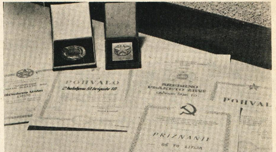
Odlikovanja in priznanja, ki jih je prejela naša teritorialna enota

Radostna je naša pot domov. Osrečujoča je zavest, da pripravljeno stojimo na braniku svobode. Jože Sevljak