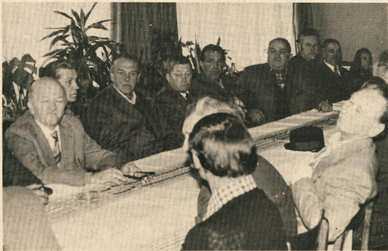
Vojaški vojni invalidi so se na prvi konferenci dogovorili o mnogih nalogah, ki jih bodo izvajali v prihodnje