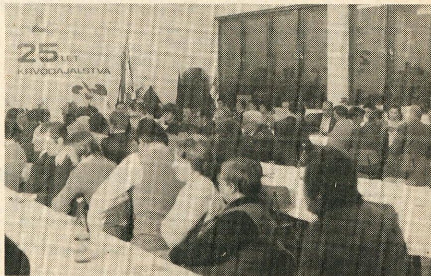
S srečanja krvodajalcev, ki je bilo v Lesni industriji Litija.