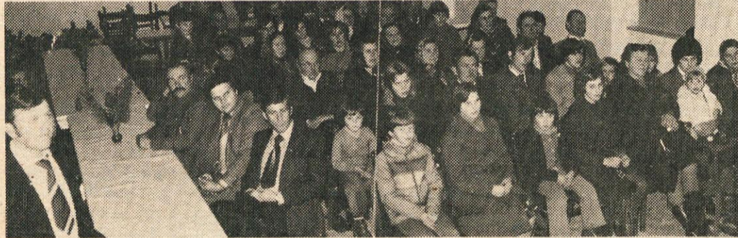
Krajanji so napolnili dvorano kulturnoprosvetnega doma.