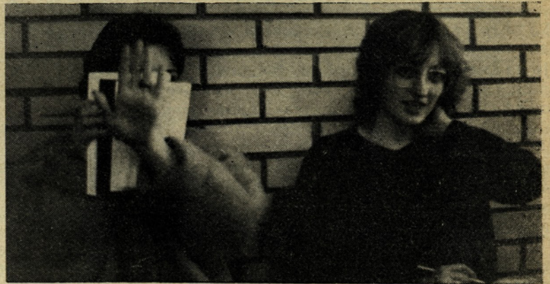
»SEDMA SILA« je vedno prisotna!