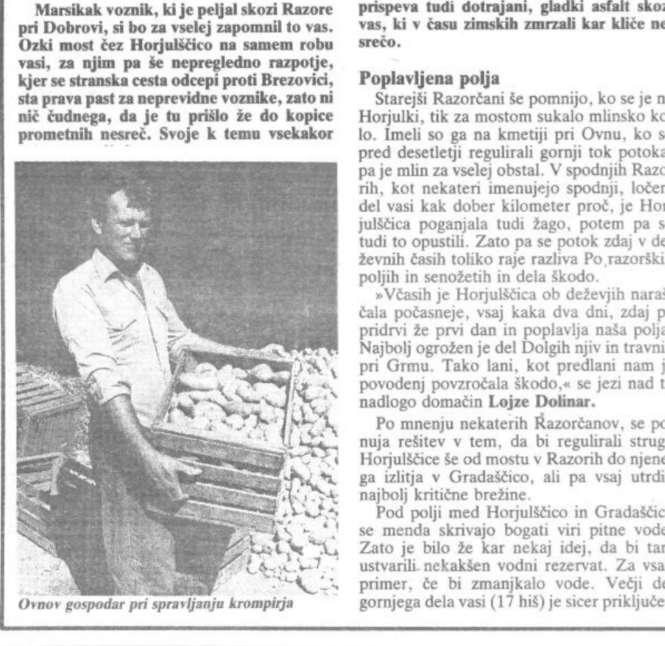
Ornov gospodar pri spravljanju krompirja