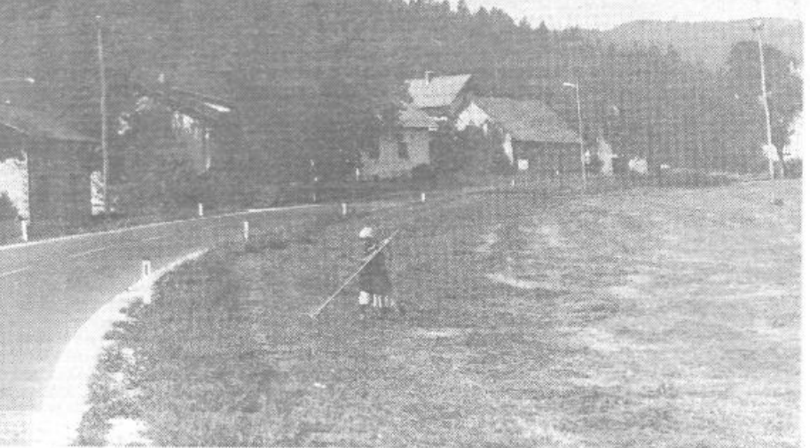
Razori: stara, dotrajana cesta je bila past že za mnoge voznike