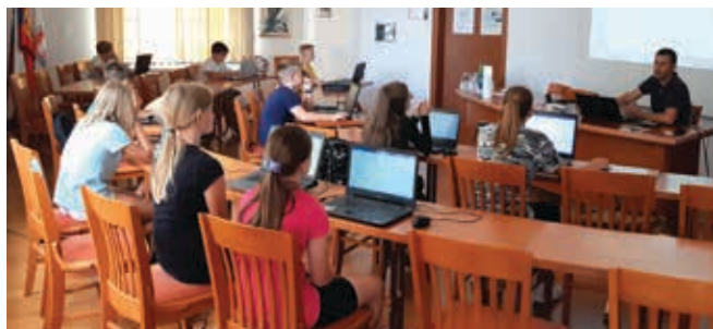
Trenutki zbranosti med poukom