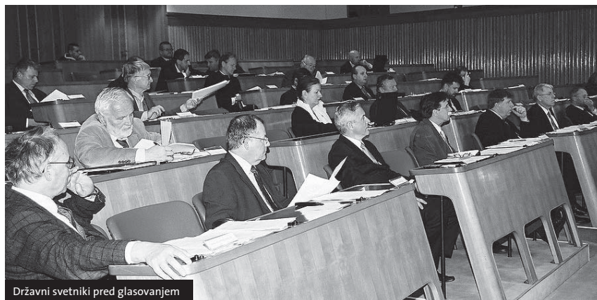
Državni svetniki pred glasovanjem

v istih stavbah državni organi in organi samoupravnih lokalnih skupnosti, ponekod pa v isti stavbi različni državni organi. V takem primeru bi bil smiseln skupen upravnik (ne upravljalavec), podobno kot ga pozna Stanovanjski zakonik, ali pa bo poseben upravljalavec poleg ravnanja s stvarnim premoženjem skrbel še za obratovanje svojega dela stavbe. Prav tako ni jasna določitev upravljalcev v primeru različnih državnih organov oziroma državnih organov, samoupravnih lokalnih skupnosti in drugih državnih organov, če le-ti uporabljajo le posamezne dele sicer enotne stavbe. Državni svet je izpostavil še vprašanja glede usklajenosti z zemljiško knjigo, katastrom in glede upravičencev za predlaganje zemljiškoknjižnih postopkov, učinkovitosti in smiselnosti upravljanja s stvarnim premoženjem države, ki ga bo izvajal vsak upravljalavec (vsak posamezen državni organ). Predlog zakona je sicer vzpostavil centralno evidenco premoženja države, ki naj bi bila zaupana ministrstvu, pristojnemu za upravo, ki bo organiziralo tudi interni trg nepremičnega premoženja države, vendar pa bi ga bilo treba zaradi posebnosti področja zaupati organu, ki bi se ukvarjal le s stvarnim premoženjem države. Po zgledu drugih držav bi se lahko ustanovila posebna nepremičninska družba kot gospodarska družba v državni lasti, ki bi kot gospodarsko dejavnost opravljala storitve ravnanja s stvarnim premoženjem države.