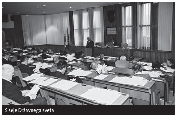
S seje Državnega sveta

Predlagana novela temelji na treh načelih: obveznosti objaviti prevzemno ponudbo, če prevzemnik doseže prevzemni prag, enakega obravnavanja vseh imetnikov vrednostnih papirjev ciljne družbe in omejevanja obrambnih mehanizmov. Predlog določa neizpodbojne domneve, da je prevzemnik odstopil od prevzemne namere, če ne opravi pravočasno dejanj v zvezi z objavo prevzemne ponudbe. Po novem naj bi prevzemnik med trajanjem postopka lahko s prevzemno ponudbo kupoval vrednostne papirje ciljne družbe tudi zunaj tega postopka, če bi pri tem spoštoval načelo enakega obravnavanja imetnikov vrednostnih papirjev ciljne družbe. V primeru, ko bi ciljna družba pred objavo prevzemne ponudbe, katere predmet so njeni vrednostni papirji, objavila svojo prevzemno namero, katere predmet so vrednostni papirji njenega prevzemnika ali druge ciljne družbe, ne bi veljala zahteva, da bi morala o nadaljnjih dejanjih v zvezi s tako prevzemno namero (in ponudbo) odločati skupščina. Sprememba zakona omogoča pravico ciljne družbe, da od prevzemnika zahteva povrnitev stroškov, ki so ji nastali v zvezi z neuspešno prevzemno ponudbo.