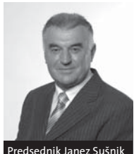
Predsednik Janez Sušnik

Državni svet je na pobudo predsednika Državnega sveta Janeza Sušnika 21. marca 2007 Državnemu zboru predlagal sprejem Zakona o spremembah in dopolnitvah zakona o prevzemih.